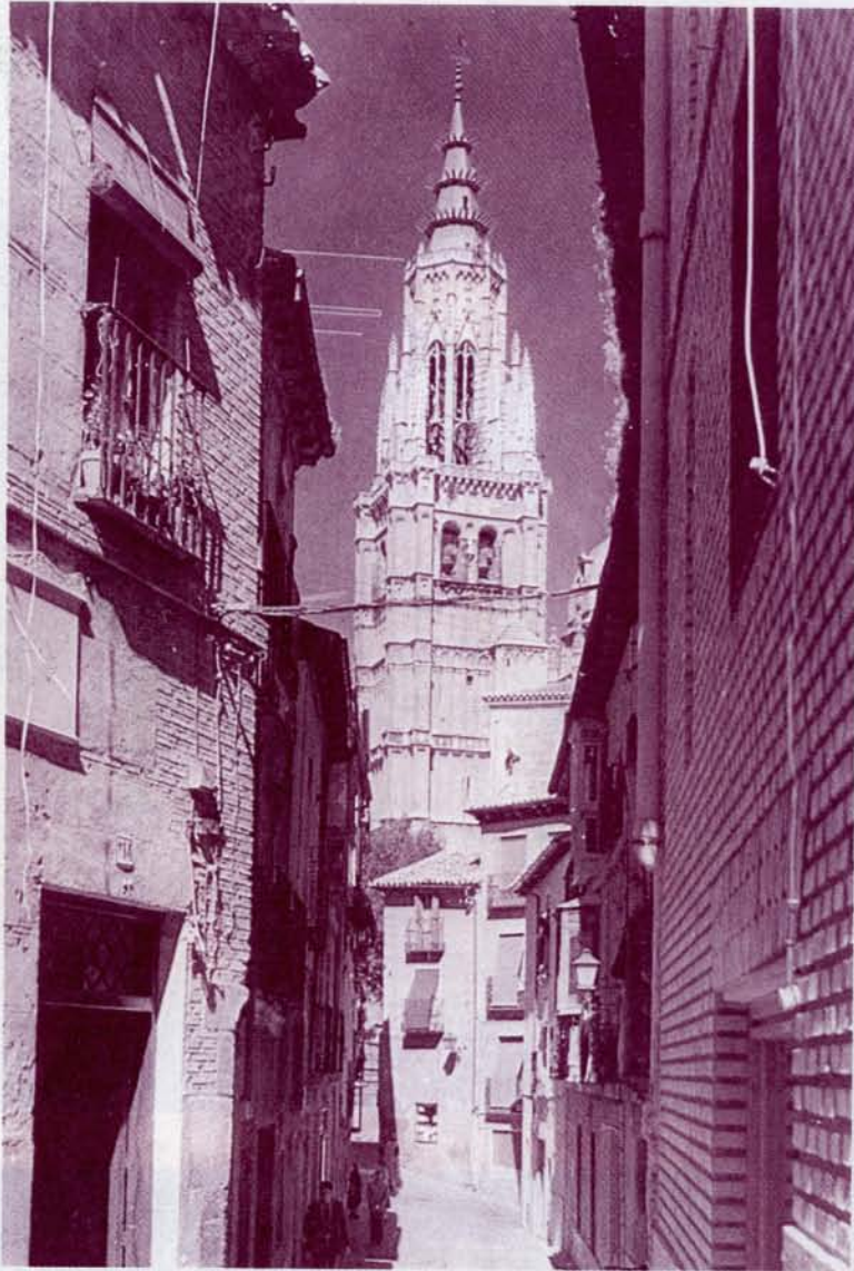
Edita: EXCMO. AYUNTAMIENTO DE TOLEDO