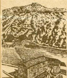
Ermita del Valle