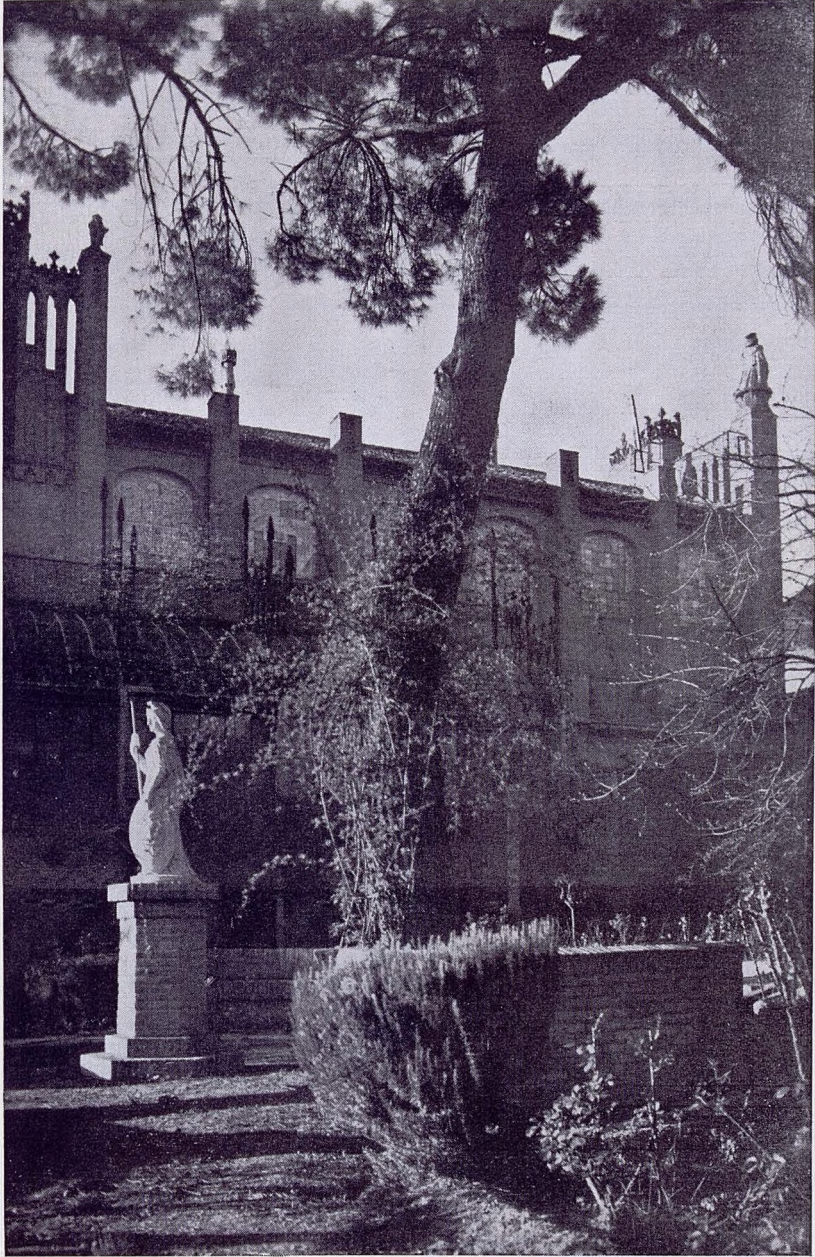
Un detalle del jardín