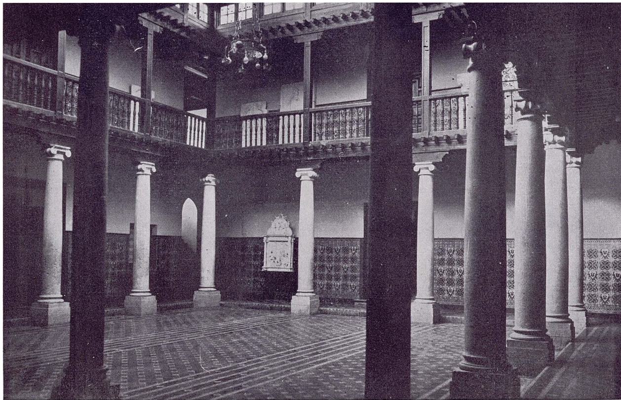
Foto del edificio de Talleres