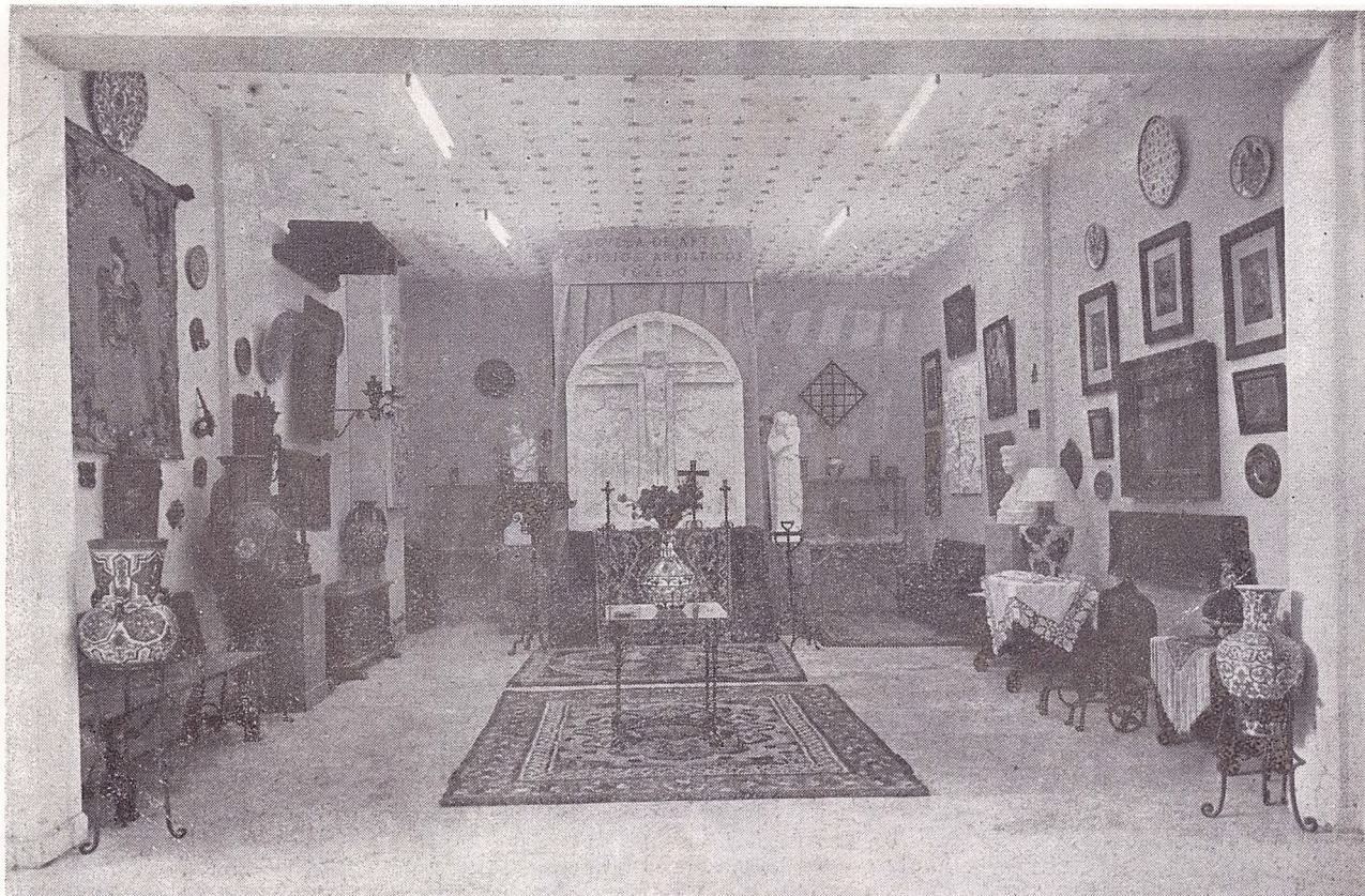
Una vista general del estand que la Escuela de Artes y Oficios Artísticos de Toledo, instaló en el Palacio de Exposiciones de Barcelona, con motivo de la II Exposición Nacional de las Escuelas de Artes y Oficios Artísticos y Elementales de Trabajo.