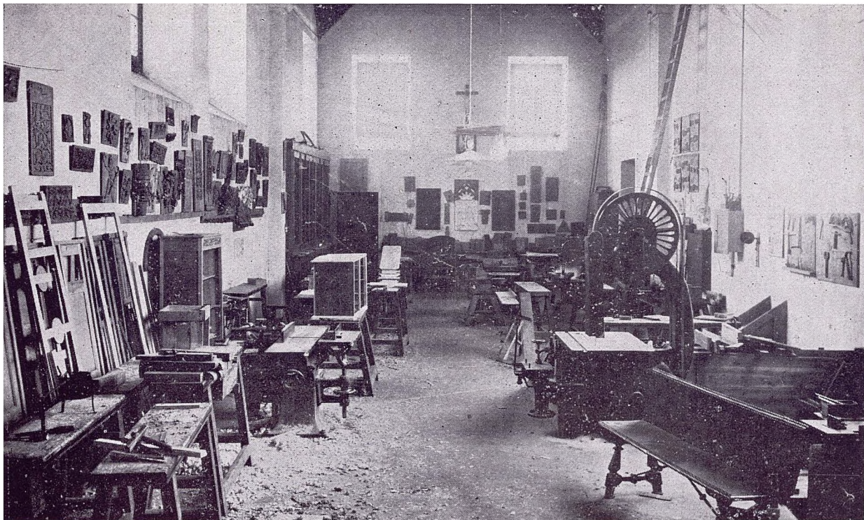
TALLER DE TALLA Y CARPINTERÍA ARTÍSTICA