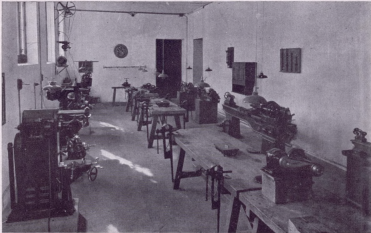
TALLERES DE APRENDIZAJE - Sección de Torno y Ajuste, en período de instalación, que será inaugurada al comenzar el curso próximo