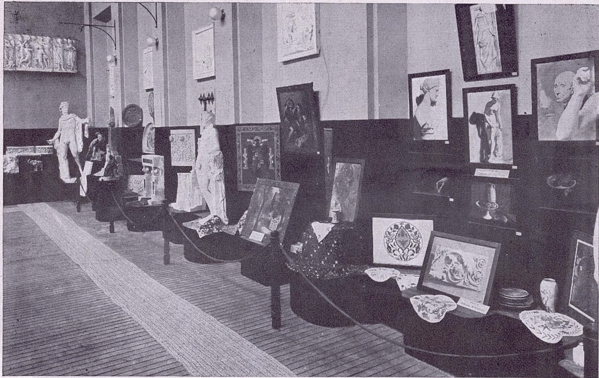
EXPOSICIÓN PERMANENTE - Vista parcial de la Sección de Clases