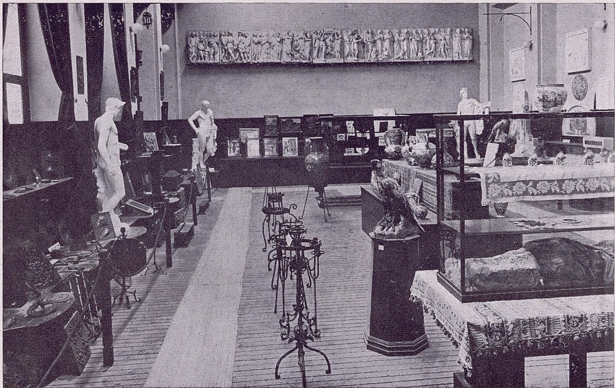
EXPOSICIÓN PERMANENTE - Vista parcial de la Sección de Talleres