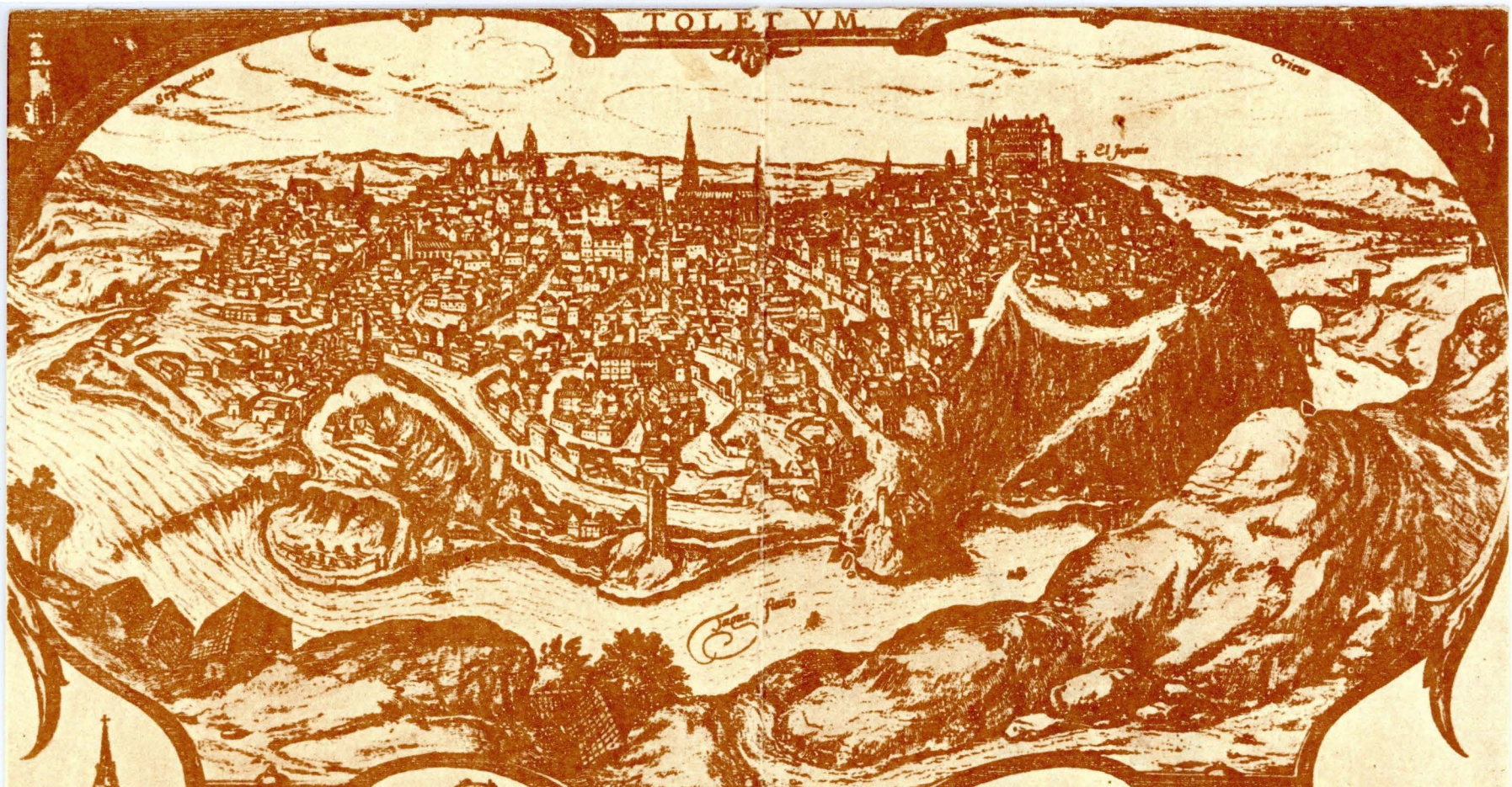
Templum Archiepiscopi Toletani