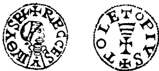
Moneda visigoda (Recesvinto)