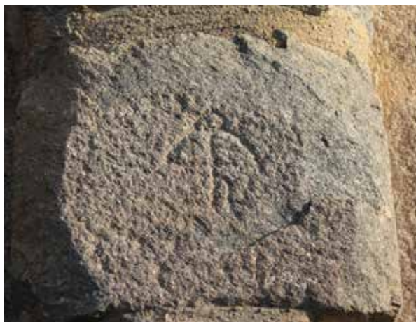
Dibujo de una ballesta, emblema los cuadrilleros de la Santa Hermandad Vieja, en el Puente de San Martín (Toledo), umbral de los Montes de Toledo.

nocibles sus murallas, las puertas de Bisagra y el Cambrón, la casa de Juan de Bargas, el Alcázar o la torre de la catedral, intuyéndose las espadañas de otros templos, además de destacarse el Puente de Alcántara y la fortaleza de San Servando, escamoteándose el Puente de San Martín, acceso directo a Los Montes. Desde luego, es evidente que el cuadro lo pintó un artista y no un cartógrafo 58 ; solo un detalle, cuando dibuja el perfil toledano desplaza hacia la izquierda tanto la Catedral como el Alcázar, para equilibrar la composición y resaltar dos de los polos del poder urbano. Además, al situarlo en la parte más baja del cuadro se destaca su impresionante silueta, que se perdería en otra perspectiva, toda vez que la posición de quien contempla la vista panorámica es muy baja con respecto al lienzo.