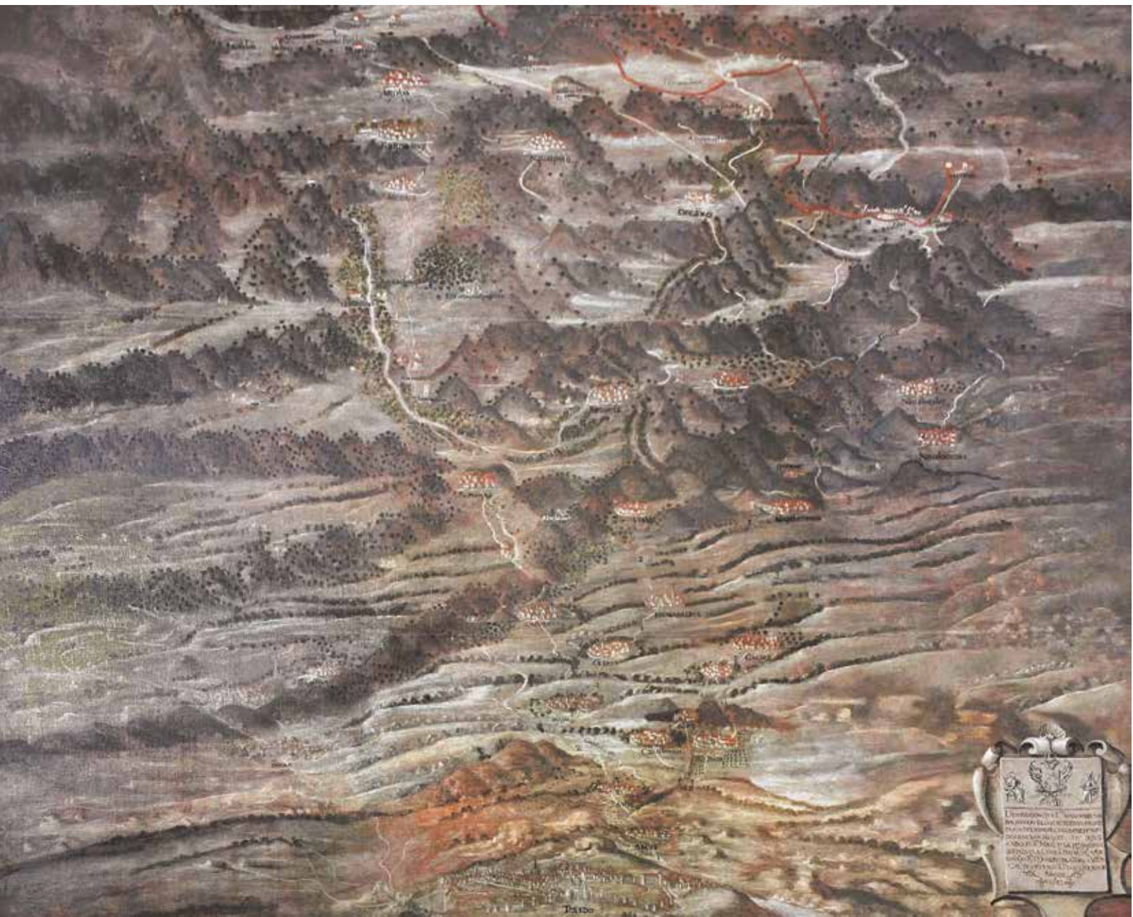
Lienzo de los Montes de Toledo, situado en la escalera de acceso a la Sala Capitular Alta del Ayuntamiento de Toledo