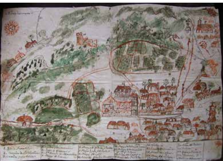
Dibujo de Navahermosa y de su poblamiento disperso, según las Descripciones del cardenal Lorenzana (1786).

También existe una intención de jerarquizar su población, o al menos intentarlo. Su mayor o menor ex-