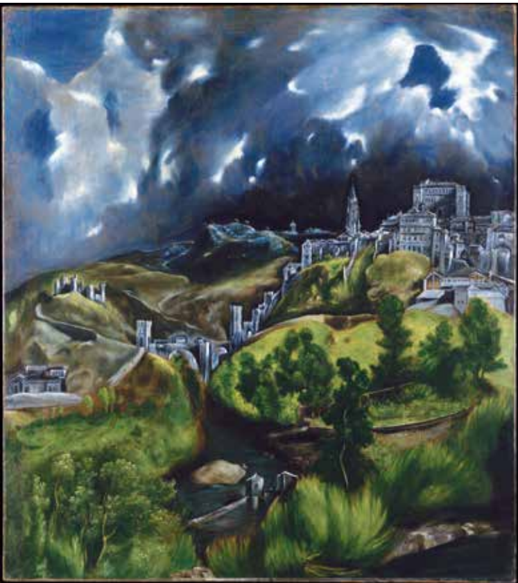
Toledo bajo la tormenta , 1597. Metropolitan Museum (Nueva York)