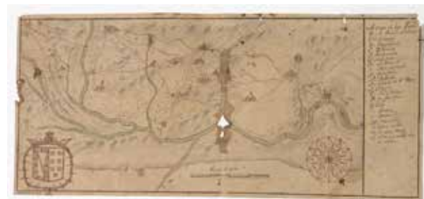
Mapa del Estado de Puebla de Alcocer (siglo XVII). AHNOB. Osuna, carp. 16, doc. 5

Una vista de ojos , bastante tosca, dibujada sobre papel hacia 1630 es fruto de la comisión encargada al regidor toledano Pedro Moctezuma y Toledo en el otoño de 1601 para dilucidar la pérdida de los Propios y Montes de Toledo en beneficio del marqués de Malagón y Por-