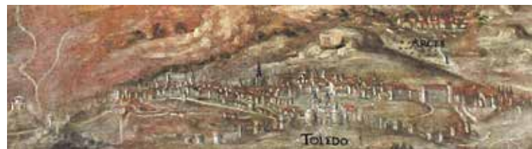
Detalle del lienzo de los Montes de Toledo. Ayuntamiento de Toledo

Contribuyó un tanto a este enredo el que en su última etapa vital, concretamente desde 1603, Doménikos Theotocopouli recibiera numerosos encargos del ayuntamiento de Toledo y que en el consistorio había un cuadro de San Agustín flanqueado por cuadrilleros que era conocido como La langosta y fue encargado al candiota en 1589, que representaba el supuesto milagro acontecido por estos lares cuando dicho santo arrojó la plaga al Tajo, como recoge Francisco de Pisa en su corografía de la Ciudad Imperial 93 .