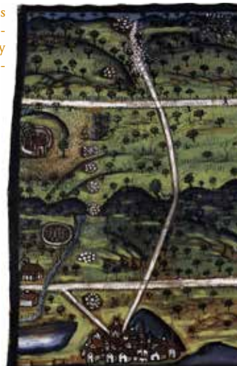
Vista de ojos de unas posadas de colmenas en el límite entre Puebla de Don Rodrigo y Agudo (1556).

Durante centurias, se limitaron las explotaciones agropecuarias en la zona y se fomentó el exterminio de los grandes depredadores (osos, lobos y zorros) y las antiguas cuadrillas se convierten en unidades fiscales 7 . Paulatinamente, se levantaron santuarios y alrededor de ellos se nuclearon pequeñas aldeas, aunque predominó un hábitat disperso. Cada pedanía tenía su término o dezmería, pastos comunales (dehesa boyal) y se toleraban pequeñas explotaciones agropecuarias. Al sur de Los Montes se hallaban las mejores tierras para la agricultura.