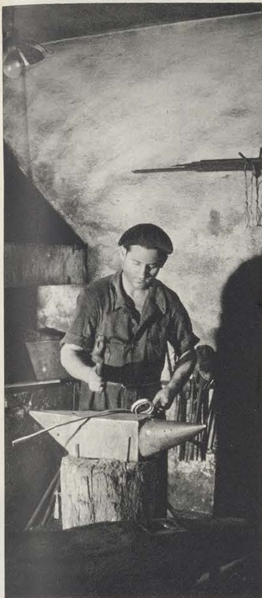
Hay que enderezar la futura hoja de la espada. A golpes de martillo, precisión y fuerza, la tira rudimentaria de acero queda a punto para la forja.