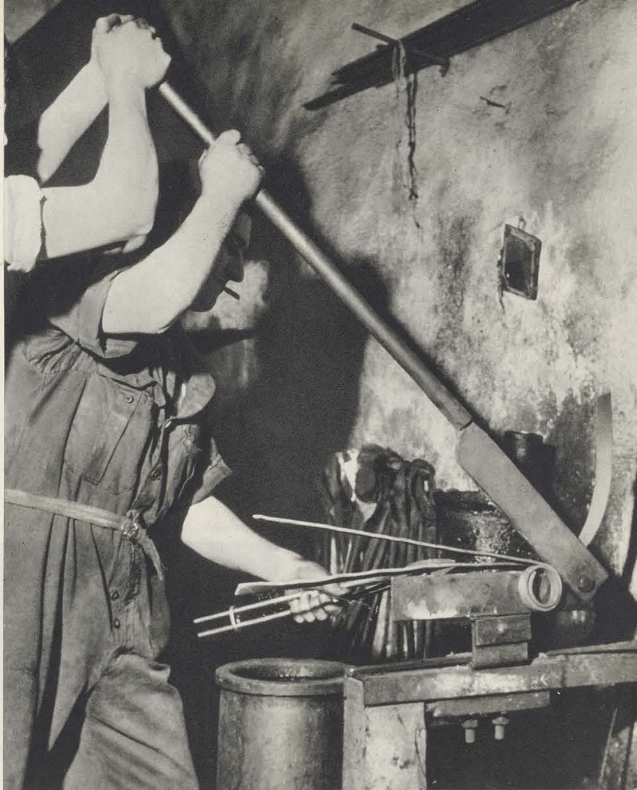
Derecha: La lámina de acero se corta a la medida. ¿Quién pensaría, viendo el material ennegrecido, en la brillante hoja en que se convertirá?