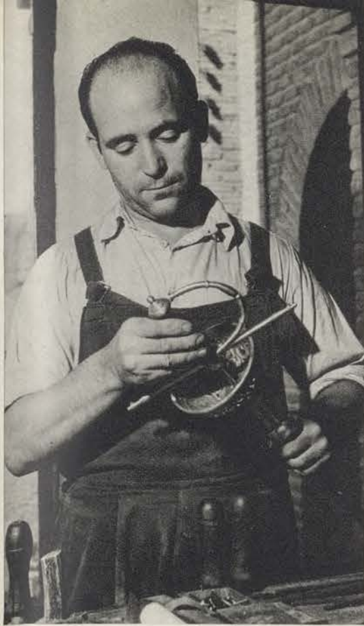
Ahora ya está la «tizona» concluída. Hoja, cazoleta, arco y empuñadura se ensamblan y constituyen el arma, orgullo de la espadería toledana.