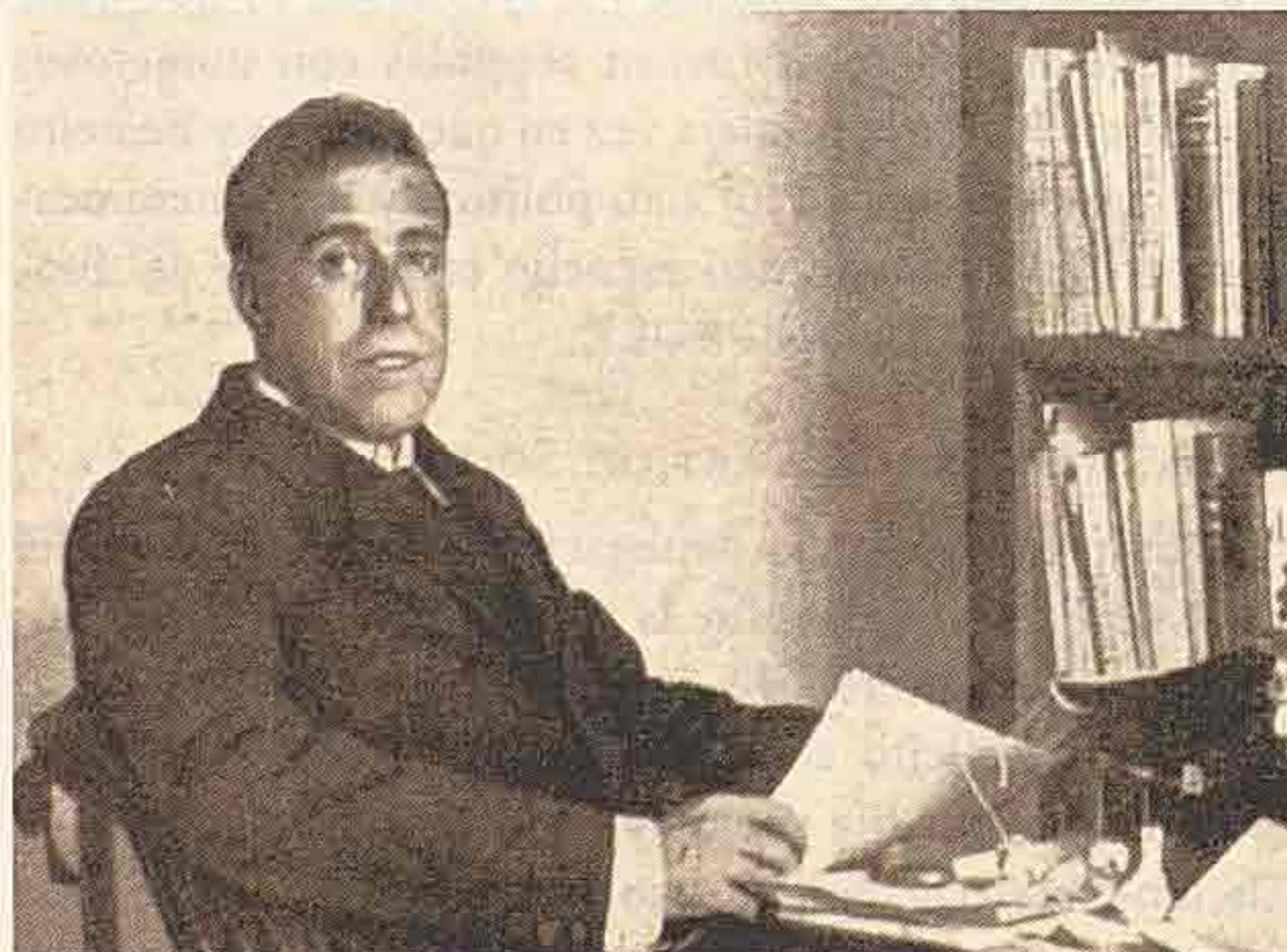
Julián Besteiro, ya diputado, en su despacho a finales de 1918.

Julián Besteiro fue condenado a reclusión perpetua e inhabilitación perpetua absoluta por delito de rebelión y el 19 de octubre ingresaba en el Penal de Cartagena. Conocida la sentencia, en la Casa del Pueblo de Toledo se inició una recogida popular de firmas en apoyo de una petición de amnistía para el catedrático y se remitió un telegrama al penado. Mensajes similares fueron enviados desde diferentes sociedades socialistas de la provincia — Pueblanueva, las Herencias, Montearagón o Consuegra— y agrupaciones obreras de la capital. Besteiro fue contestando a todas ellas y esas respuestas eran reflejadas en “El Heraldo Obrero”. Significativa fue la respuesta dada a la Sociedad de Electricistas de Toledo, en la que el catedrático afirmaba que falta hacía que en esa capital los trabajadores se incorporen a la acción política desechando viejos prejuicios 18 .