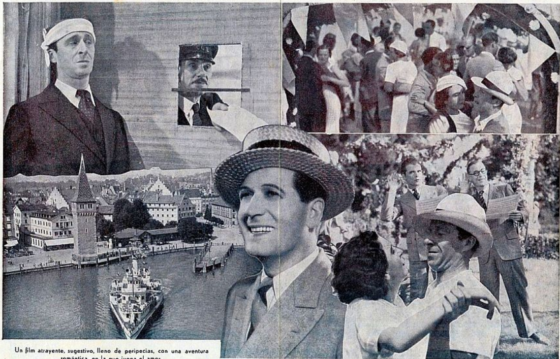
Un film atrayente, sugestivo, lleno de peripecias, con una aventura romántica, en la que juega el amor.