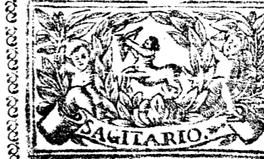
Noviembre tiene 30 dias, la Luna 29