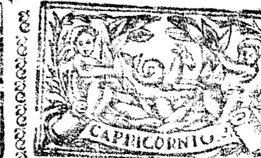
Diciembre tiene 31 dias, la Luna 30