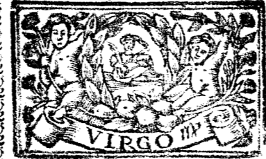
Agosto tiene 31 dias, la Luna 30.