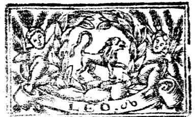
Julio tiene 31 dias, la Luna 30.