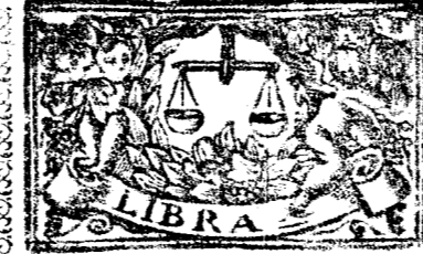
Septiembre tiene 30 dias, la Luna 29