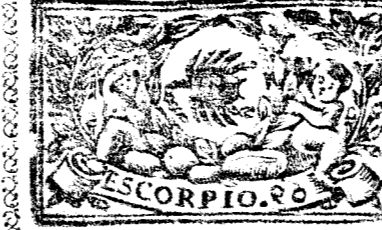
Octubre tiene 31 dias, la Luna 30.