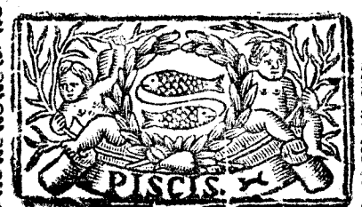
Febrero tiene 28. dias, la Luna 29.