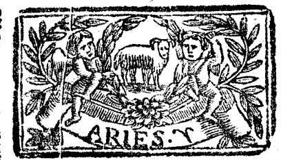
Marzo tiene 31. dias, la Luna 30.