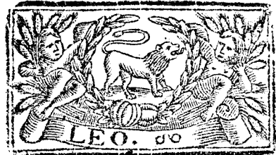
Julio tiene 31. dias, la Luna 30.