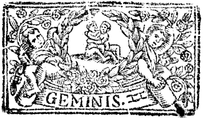
Mayo tiene 31. dias, la Luna 30.