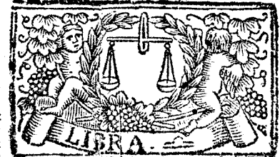
Septiembre tiene 30. dias, la Luna 29.