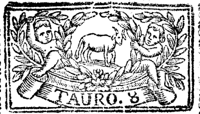
Abril tiene 30. dias, la Luna 29.