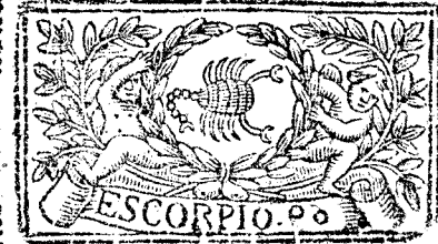
Octubre tiene 31. dias, la Luna 30.