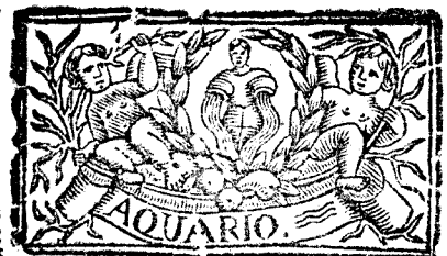
Enero tiene 31. dias, la Luna 30.

Juicio del Año. Por nuestras Tablas Philipicas formando el Calculo Astronomico, con su Logistica especiosa se halla, que el Año Astrológico tendrá principio, juntamente con la florida Primavera, dia 20. de Marzo, à las 9. y 55. minutos de la noche, siendo horoscopante en el Horizonte Matritense el grado 17. de Escorpion, y en el angulo regio el grado 27. de Leon, estando Saturno en el grado 28. de Capricornio, y en el domicilio tercero; Jupiter retrogrado en 12. de Virgo, y en el regio domicilio; Marte en 21. de Aquario, y en el domicilio tercero; el Sol en el punro Equinoccial de Arie, y en el quinto domicilio; Venus en 14. de Aquario, y en el domicilio tercero en conjuncion con Marte; Mercurio retrogrado en 13. de Arie, debaxo de los rayos Solares, y en el quarto domicilio; la Luna en 28. de Geminis, y en el octavo domicilio, con irradiacion quadrada del Sol, y Mer-