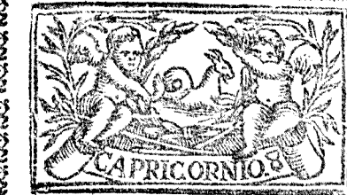
Diciembre tiene 31. dias, la Luna 30.