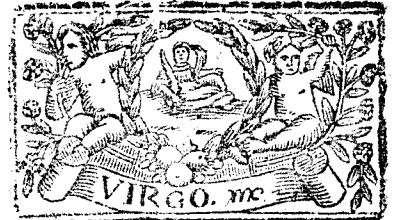
Agosto tiene 31. dias, la Luna 30.