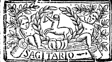
Noviembre 30. dias, la Luna 29.