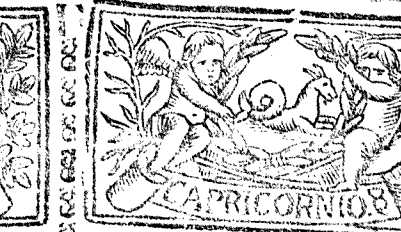
Diciembre tiene 31. dias, la Luna 30.