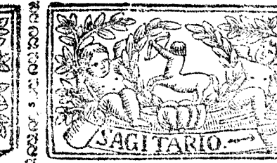
Noviembre 30. dias, la Luna 29.