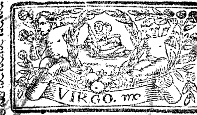
Agosto tiene 31. dias, la Luna 30.