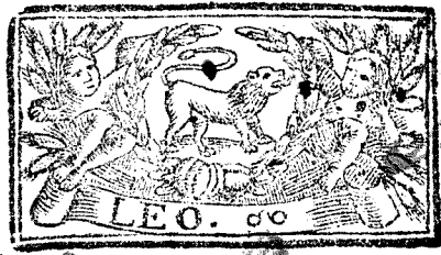
Julio tiene 31. dias, la Luna 30.