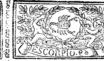
Octubre tiene 31. dias, la Luna 30.