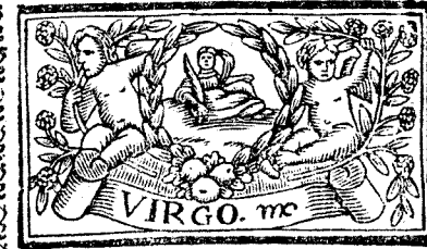
Agosto tiene 31. dias, la Luna 30.