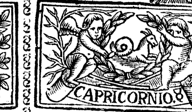
Diciembre tiene 31. dias, la Luna 30.