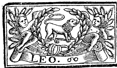
Julio tiene 31. dias, la Luna 30.