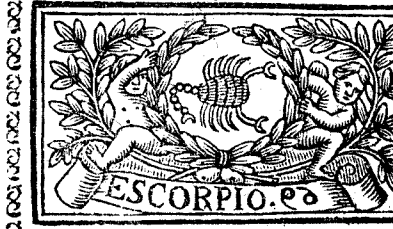
Octubre tiene 31. dias, la Luna 30.