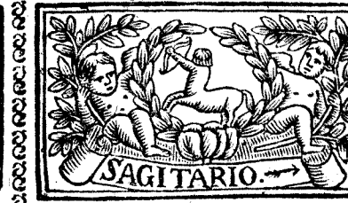
Noviembre 30. dias, la Luna 29.