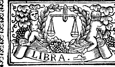
Septiembre tiene 30. dias, la Luna 29.