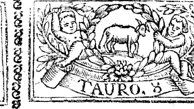
Abril tiene 30. dias, la Luna 29.