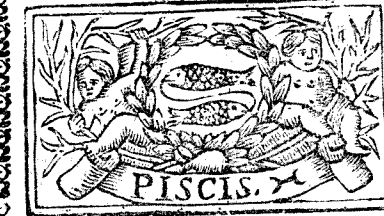
Febrero tiene 29. dias, la Luna 29.