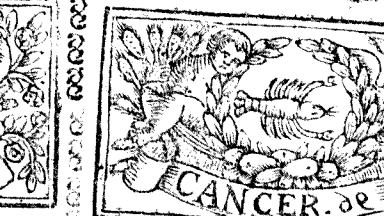
Junio tiene 30. dias, la Luna 29.