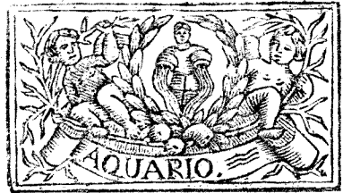
Enero tiene 31. dias, la Luna 30.

Juicio del Año. Con Regia soberania, y magnificos resplandores llega el Principe Helíaco à su dorado vellocino, para celebrar en su exaltacion gloriosa el cumple años de su natal augusto, felicitando propicio à todo el Emisferio Boreal con las generosas influencias de la florida Primavera, cuyo principio será dia 26. de Marzo, à las 4. y 53. minutos de la mañana, siendo Horoscopante en el Horizonte hermoso de la Imperial Villa Carpetana el grado 3. de Píscis; Saturno retrogrado en el grado 9. de Escorpion, y melancolico en el octavo domicilio; y Jupiter en 13. de Aquario, y muy displicente en el domicilio duodécimo con la irradiacion quadrada de la Saturnina influencia; Marte en 2. de Tauro, y en