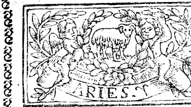
Marzo tiene 31. dias, la Luna 30.