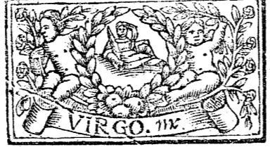
Agosto tiene 31 dias, la Luna 30.