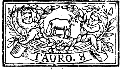
Abril tiene 30. dias, la Luna 29.