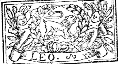
Julio tiene 31 dias, la Luna 30.