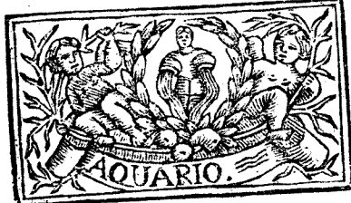
Enero tiene 31. dias, la Luna 30.

Juicio del Año. Bien ilustrada con la luz de continuas experiencias la antiguedad Astrológica, fue de opinion irrefragable en formar el Juicio, y Pronostico General de los futuros acontecimientos de cada Año por el Sytéma Celeste, que se contempla al momento en que el Sol con su centro ocupa el punto Equinoccial de Arie, cuya opinion defendien, y figuran los Astrologos famosos de estos tiempos, y la observamos en nuestras predicciones Annuas, y así, haviendo hallado por nuestro calculo Astronomico, que en el presente Año se celebra el arribo del mayor Luminar al punto cardinal de Arie, dia 20. de Marzo, à las 10. y 50. ms. de la noche, tambien se halla ser Horoscopante por el Horizonte Matritense el grado 20. de Escorcion, y culminante el grado 11. de Virgo,