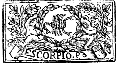
Octubre tiene 31 dias, la Luna 30.