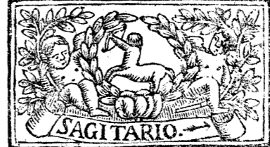
Noviembre tiene 30 dias, la Luna 29.