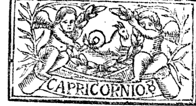
Diciembre tiene 31 dias, la Luna 30.