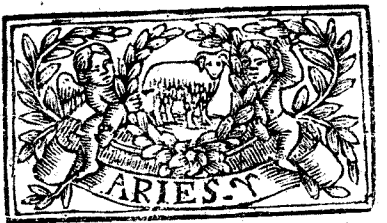
Marzo tiene 31. dias, la Luna 30.