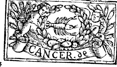
Junio tiene 30. dias, la Luna 29.