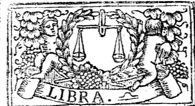
Septiembre 30. dias, la Luna 29.