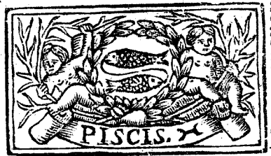
Febrero tiene 28. dias, la Luna 29.