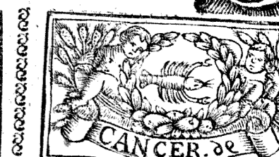
Junio tiene 30 dias, La luna 29.