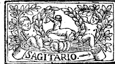
Noviembre tiene 30. dias, la Luna 29.