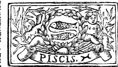
Febrero tiene 28 dias, la Luna 29.