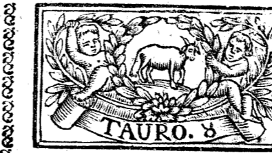
Abril tiene 30 dias, la Luna 29.