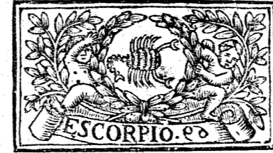
Octubre tiene 31. dias, la Luna 30.