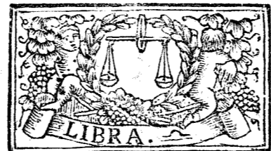
Septiembre tiene 30. dias, la Luna 29.