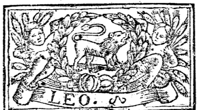
Julio tiene 31. dias, la Luna 30.