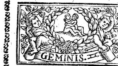
Mayo tiene 31 dias, la Luna 30.