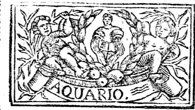
Enero tiene 31 dias, la Luna 30.