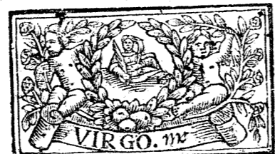
Agosto tiene 31. dias, la Luna 30.