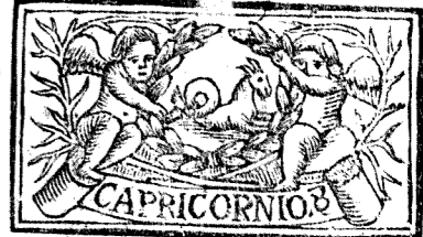
Diciembre tiene 31. dias, la Luna 30.