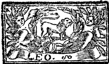
Julio tiene 31. dias, la Luna 30.