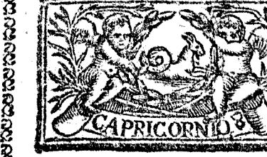
Diciembre tiene 31. dias, la Luna 30.