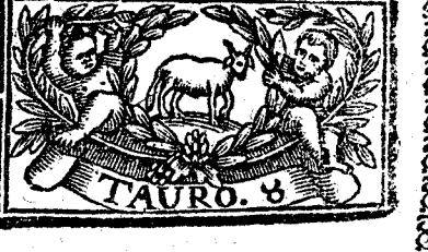
Abriltiene 30. dias, la Luna 29.