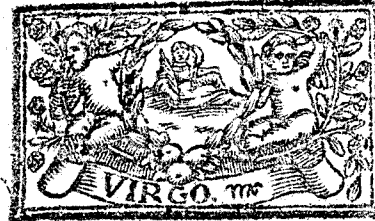
Agosto tiene 31. dias, la Luna 30.