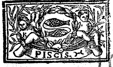
Febrero tiene 29. dias, la Luna 30.