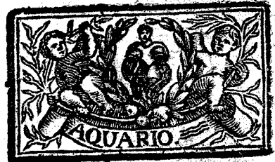
Febrero tiene 29. dias, la Luna 30.