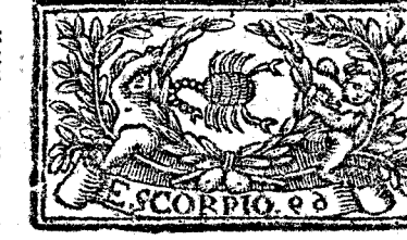
Octubre tiene 31. dias, la Luna 30.