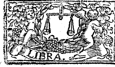
Septiembre tiene 30. dias, la Luna 29