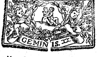
Mayotiene 31. dias, la Luna 30.