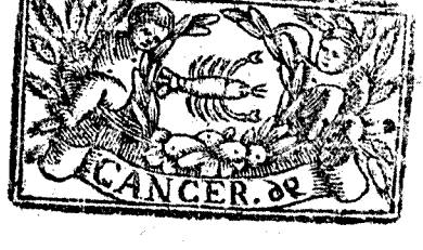
Junio tiene 30. dias, la Luna 29.