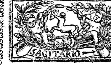
Noviembre tiene 30. dias, la Luna 29.