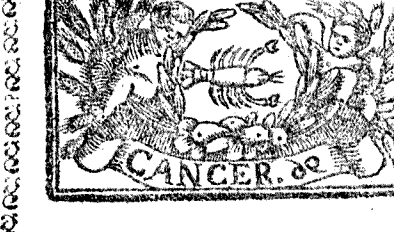
Junio tiene 30. dias, la Luna 29.

23 Juev. S. Paulino Obispo, y Conf. y S. Basileo Martyr. Zamora. 24 Mierc. S. Juan Regis, y S. Robustiano Mart. Tempora. 25 Juev. Santa Maria Magdalena de Pazzis, y S. Urbano P. y M. Anima. 26 Vier. S. Phelipe Neri Conf. Temp. 27 Sab. S. Juan Papa, y Mart. Tempora. Anima. 28 Dom. La Santissima Trinidad, y S. Justo, y S. German. 29 Lun. S. Maximino Ob. y Conf. 30 Mart. San Fernando, Rey de España. Luna llena à las 11. y 15. ms. del dia, en Sagitario. Vario, nubes, y viento humedo. 31 Mierc. Santa Petronila Virg.