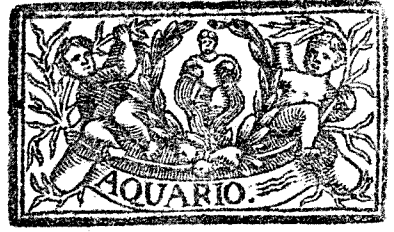
Enero tiene 31. dias, la Luna 30.

E L Año Astrologico, segun recto computo, tiene principio, juntamente con la florida Primavera, dia 20. de Marzo, 29. minutos despues de medio dia, ascendiendo por el clarissimo Horizonte de la Coronada Villa de Madrid el grado 25. de Cancer, y culminante el grado 8. de Ariete. Saturno retrogrado en el gra-