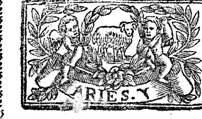
Marzo tiene 31. dias, la Luna 30.

Quarto creciente à la una, y 33. ms. del dia, en Geminis. Vario, y despues rebuelto con viento, nubes, y nieblas. 23 Juev. Santa Marta Virg. y Mart. y Santa Margarita de Cortona. Vigilia. 24 Viern. San Matbias Apostol. Tempora. Jubileo. Tendilla.