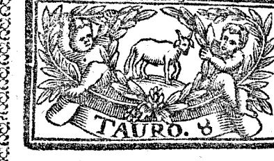
Abril tiene 30. dias, la Luna 29.

25 Sab. La Anunciancion de N. Señora, y Encarnacion del Hijo de Dios, y el Buen Ladrón. Anima. Ay Bendicion Papal en San Agustin. 26 Dom. de Ramos, y San Braulio Obispo. Ay Procecion General. 27 Lun. S. Ruperto Ob. y Conf. 28 Mart. S. Castor, y Doroteo. 29 Mierc. San Eustasio Abad. 30 Juev. Santo, S. Juan Climaco Abad. 31 Viern. Santo, Santa Balbina Virg.