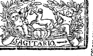
Noviembre tiene 30. dias, la Luna 29.