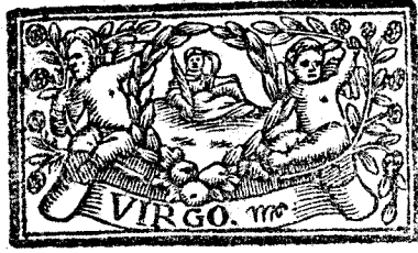
Agosto tiene 31. dias, la Luna 30.