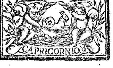
Diciembre tiene 31. dias, la Luna 30.