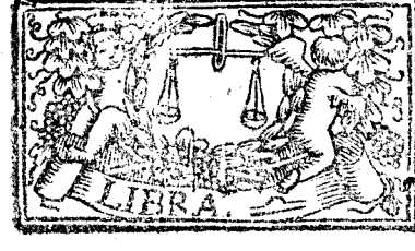
Septiembre tiene 30. dias, la Luna 29.