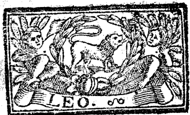
Julio tiene 31. dias, la Luna 30.