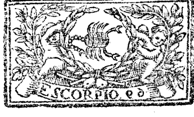
Octubre tiene 31. dias, la Luna 30.