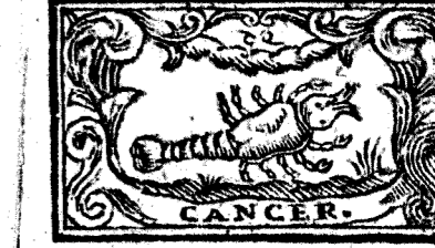
Junio tiene 30. dias, la Luna 29.

58 Mierc. de CENIZA, Santa Marta V. y M. y Santa Margarita de Cortona. Vigilia. Cierranse las Velaciones. 59 Juev. S. Matias Apofol. Jubileo * Tendilla. 60 Vier. S. Cesario Ob. y Conf. Luna nueva a las 5. y 8. ms. de la tarde, en Pifces. Rebuelt. con nubes, lluvias, y nieblas.