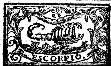
Octubre tiene 31 dias, la Luna 30.