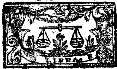
Septiembre tiene 30 dias, la Luna 29.