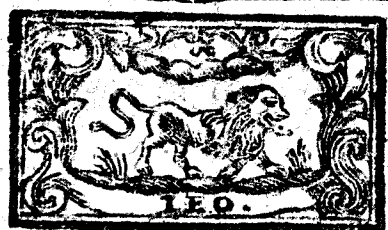
Julio tiene 31 dias, la Luna 30.