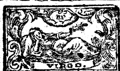
Agosto tiene 31 dias, la Luna 30.