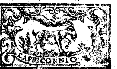
Diciembre tiene 31 dias, la Luna 30.