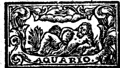
Enero tiene 31. dias, la Luna 30.

Segun la Politica Institucion Juliana, en el dia primero de Enero empieza el Año Civil; pero el Astrologico en el momento, que el Sol hace ingreso en el Celeste Ariete, donde tiene su principio la florida Primavera dia 21. de Marzo, a la una, y 36. minutos de la mañana, ascendiendo por el coronado Horizonte Carpentano el grado 3. de Capricornio, estant-