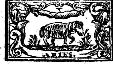
Marzo tiene 31. dias, la Luna 30.

44 Mierc. de CENIZA, Santa Marta V. y M. y Santa Margarita de Cortona. Vigilia. Cierranse las Velaciones. 45 Juev. S. Matias Apofol. Jubileo * Tendilla. 46 Vier. S. Cesario Ob. y Conf. Luna nueva a las 5. y 8. ms. de la tarde, en Pifces. Rebuelt. con nubes, lluvias, y nieblas.