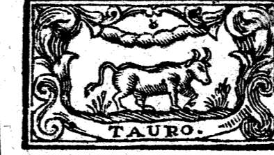
Abril tiene 30. dias, la Luna 29.

44 Mierc. de CENIZA, Santa Marta V. y M. y Santa Margarita de Cortona. Vigilia. Cierranse las Velaciones. 45 Juev. S. Matias Apofol. Jubileo * Tendilla. 46 Vier. S. Cesario Ob. y Conf. Luna nueva a las 5. y 8. ms. de la tarde, en Pifces. Rebuelt. con nubes, lluvias, y nieblas.