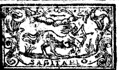
Noviembre tiene 30 dias, la Luna 29.