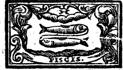
Febrero tiene 28. dias, la Luna 29.

39 Mierc. de CENIZA, Santa Marta V. y M. y Santa Margarita de Cortona. Vigilia. Cierranse las Velaciones. 40 Juev. S. Matias Apofol. Jubileo * Tendilla. 41 Vier. S. Cesario Ob. y Conf. Luna nueva a las 5. y 8. ms. de la tarde, en Pifces. Rebuelt. con nubes, lluvias, y nieblas.