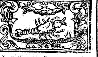
Junio tiene 30. dias, la Luna 29.

20 Dom. La Santissima Trinidad, y S. Bernardino de Sena Conf. Luna llena à las 6. y 5. ms. de la tarde, en Sagit. Vientos, y nubes. 21 Juev. S. Eusebio Obisp. y Mart. y S. Luis Gonzaga Conf. ESTIO. Sol en Cancer. 22 Vier. S. Paulino Ob. y Conf. 23 Sab. S. Juan Presbyt. y M. Vigilia. 24 Do. La Nativid. de S. Juan Baptiff. * Segovia, Leon, Soria, y Zamora. 25 Lun. S. Guillermo Conf. 26 Mart. S. Juan, y S. Pablo Mrs. Quarto meng. à las 4. y 51. ms. de la tarde, en Aries. Vario, y viento humedo, ò lluvias.