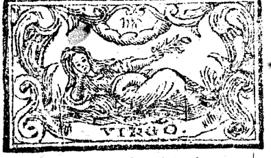
Agosto tiene 31. dias, la Luna 30.