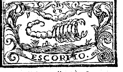
Octubre tiene 31. dias, la Luna 30.