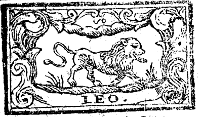
Julio tiene 31. dias, la Luna 30.