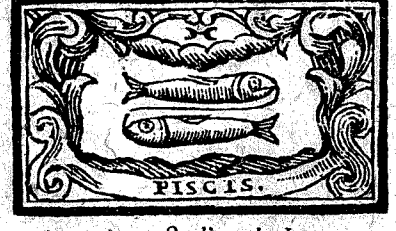
Febrero tiene 28. dias, la Luna 29.

29 Lu. S. Francisco de Sales O. y C. 30 Mart. Santa Martina Virg. y M. 31 Mier. S. Pedro Nolaco Fundad. Abolucion General en la Merced. Quarto meng. à las 4. y 46. ms. de la mañ. en Escorp. Viento frio.