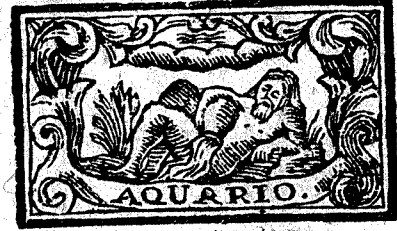
Enero tiene 31. dias, la Luna 30.

E l Año Civil de la Institucion Juliana, tiene principio dia primero de Enero; pero el Astrologico, en