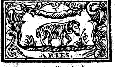
Marzo tiene 31. dias, la Luna 30.

22 Juev. La Cathedra de S. Pedro en Antiochia, y S. Pascasio Ob. * Zamora. 23 Vier. Santa Marta V. y M. y Santa Margarita de Cortona. Vigilia. 24 Sab. S. Mathias Apóstol. Jubileo. * Anima. * Tendilla. 25 Dom. S. Cesario Conf. * Anima. 26 Lun. S. Alexandro Obispo. 27 Mart. S. Baldomero Conf. 28 Mierc. S. Roman Abad.