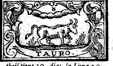
Abril tiene 30. dias, la Luna 29.

1 Dom. de Quasimodo, S. Venancio Ob. y M. y la Impresion de las Llagas de S. Cathalina de Sena. Hay Procecion General. Abrense las Velaciones.