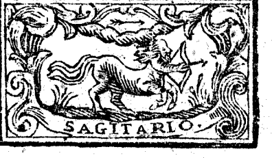
Noviembre tiene 30. dias, la Luna 29.