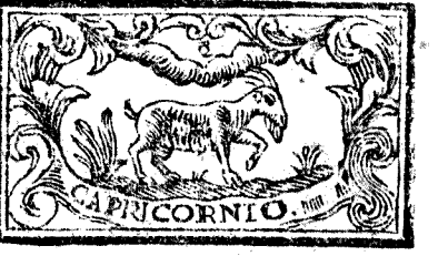
Diciembre tiene 31. dias, la Luna 30.