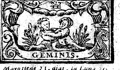
Mayo tiene 31. dias, la Luna 30.

28 Sa. S. Vidal M. y S. Prudencio Ob. 29 Dom. S. Pedro Mart. Quarto meng. à las 6. y 2. ms. de la mañ. en Aquar. Vientos frios, y lluv. 30 Lun. S. Cathalina de Sena Virg. LETANIAS. Abstinencia.