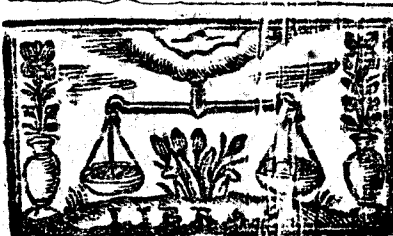
Septiembre tiene 30. dias, la Luna 29.

1 Mart. S. Pedro Advincula, y los hermanos Machabeos Mrs. 2 Mi. N. Señora de los Angeles, S. Estevan P. y M. y S. Pedro Ob. Jubil. 3 Juev. La Invenccion de S. Estevan. 4 Vi. S. Domingo de Guzman Fund. 5 Sab. N. Señora de las Nieves. 6 Dom. La Transfiguracion del Señor, y S. Justo, y Pastor, hers. Ms. 7 Lun. S. Cayetano, Fundador, y S. Alverto de Sicilia. 8 Mart. S. Cyriaco, y Comp. Mrs. 9 Mier. S. Roman Martyr. Vigilia. 10 Juev. S. Lorenzo Mart. * Escorial. Absolucion General en la Merced. 11 Vier. S. Tiburcio, y Susana Mrs. 12 Sab. Santa Clara Virg. 13 Do. S. Hypólito, y Casiano Ms. 14 Lun. S. Eusebio Conf. Vigilia. 15 Mar. La Assuncion de N. Señora. * Ciudad. Real, Jaen, y Aracena. 16 Mi. S. Jacinto, y S. Roque Conf. Hay Procecion General. 17 Juev. S. Paulo, y Juliana Mrs. 18 Vier. S. Agapito M. y S. Helena. 19 Sab. S. Luis Obispo. 20 Dom. S. Bernardo Abad, Fund. 21 Lun. S. Bata, y 3. hijos Mrs. 22 Mart. S. Sincriciano, y Fabriciano Martyres. 23 Mierc. S. Phelipe Benicio Conf. Vigilia. Sol en Virgo. 24 Juev. San Bartholomé Apostol. * Alcalá de Henares, Almagro, Villadiego, y Martin. Muñoz. 25 Viern. S. Luis Rey de Francia, y S. Gines de Arles Mart. 26 Sab. S. Zeferino Pap. y Mart. 27 Dom. S. Rufo Ob. y Mart. 28 Lun. S. Agustin Ob. De Tor. y Fund. 29 Ma. La Degoll. de S. Juan Bapt. 30 Mierc. Santa Rosa de Lima. 31 Juev. S. Ramon Nonnato Conf.