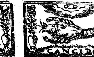
Junio tiene 30. dias, la Luna 29.

24 Mier. S. Robustiano M. y B. Juan Francisco Regis. 25 Jue. S. Maria Magdalena de Pavis V. y S. Urbano Pap. y M. 26 Jue. S. Maria Magdalena de Pavis V. y S. Urbano Pap. y M. 27 Sab. S. Juan Papa, y M. Vigilia. 28 Dom. Pascua de Espiritu Santo, y S. Justo, y S. German Ob. y C. 29 Lun. Fiebla, S. Maximino O. y C. 30 Mart. S. Fernando, Rey de España. 31 Mi. S. Petronila Virg. Tempora.