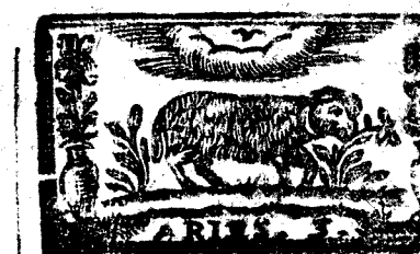
Marzo tiene 31. dias, la Luna 30.

25 Sab. S. Cefario Conf. 26 Dom. S. Alexandre Obispo. 27 Lun. S. Balduino Conf. 28 Mar. S. Roman Abad. ✕ Anima.