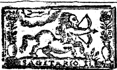
Noviembre tiene 30. dias, la Luna 29.

1 Dom. N. Señora del Rosario, y S. Remigio Ob. y Conf. Jubileo. 2 Lun. S. Saturnio Conf. * Jumilla. 3 Mart. S. Candido Mart. 4 Mier. S. Francisco de Afsis, Fund. * Sigüenza, y Villarejo. 5 Juev. S. Placido, y Comp. Mrs. 6 Viern. S. Bruno Fundador. 7 Sa. S. Marcos Pap. y S. Sergio M. 8 Dom. S. Brigida Viuda. 9 Lun. S. Dionysio Areop. Ob. y M. 10 Mar. S. Francisco de Borja Conf. y S. Luis Beltran Conf. 11 Mier. S. Fermin, y S. Nicasio Obs. 12 Jue. N. S. del Pilar de Zaragoza, y S. Felix, y Cypriano Obs. y Ms. 13 Viern. S. Fausto, y Comp. Mrs. 14 Sab. S. Calixto Pap. y Mart. 15 Dom. S. Teresa de Jesus Virg. 16 Lun. S. Galo Abad. 17 Mart. S. Heduvigis Viuda. 18 Mierc. S. Lucas Evangelista. * Fregenal, Torija, Villadiego, y Cea. 19 Juev. S. Pedro de Alcantara C. 20 Viern. S. Irene Virg. y Mart. 21 Sab. S. Hilarion Abad, S. Ursula, y las 11. mil Virgs. Mrs. 22 Dom. S. Maria Salomé. 23 Lun. S. Pedro Pascual Ob. y M. y S. Juan Capistrano Conf. Sol en Escorpion. 24 Mart. S. Rafael Archangel. 25 Mier. S. Christifanto, y Daria, Crispin, y Crispiniano Mrs. 26 Juev. S. Evaristo Pap. y Mart. 27 Vier. S. Vicente, Sabina, y Christeta Mrs. de Avila. Vigilia. 28 Sab. San Simon, y S. Judas Apost. * Valdemora. 29 Dom. S. Narciso Ob. y Mart. 30 Lun. S. Claudio, y Comp. Ms. 31 Mart. S. Quintin Mart. Vigilia.