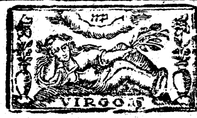
Agosto tiene 31. dias, la Luna 30.

1 Sab. S. Casto, y Segundino Mrs. 2 Do. La Visitacion de N. Señora. 3 Lun. S. Trifon, y 12. Comp. Mrs. 4 Ma. S. Laureano Arzob. de Sevilla 5 Mierc. S. Zoa Mart. 6 Juev. S. Lucia Mart. 7 Vie. S. Fermin Ob. y S. Udón Ob. 8 Sab. S. Isabel, Reyna de Portugal. 9 Dom. S. Cyriilo Ob. y Mart. 10 Lun. Santa Rufina, y Segunda, y los 7. hermanos Mrs. 11 Mart. S. Pio Pap. y Mart. y S. Abundio Martyr de Cordoba. 12 Mierc. S. Nabor, y Felix Mrs. y S. Juan Gualberto Abad. 13 Juev. San Anacleto Pap. y M. 14 Vi. S. Buenaventura Ob. y Doct. 15 Sab. S. Henrique Emperador. 16 Dom. El Triunfo de la S. Cruz, y N. Señora del CARMEN. 17 Lun. S. Alexo Conf. 18 Mart. S. Simphorosa, y sus 7. hijos Mrs. y S. Marina Virg. y M. 19 Mier. S. Justa, y Rufina V. y Ms. 20 Juev. S. Elias Profeta, S. Librada, y Margarita Virg. y Mrs. 21 Viern. S. Praxede Virg. 22 Sab. S. Maria Magdalena. 23 Dom. S. Apolinar Ob. y Mart. 24 Lun. S. Chullina Virg. y M. y S. Francisco Solano Conf. Vigilia. 25 Mart. Santiago Apostol, Patron de España, y S. Christoval M. * Merida. 26 Mier. S. Ana, Madre de N. Señora Hay Procecion General. 27 Juev. S. Pantaleon Mart. 28 Vie. S. Victor Pap. S. Nazario, y Celso Mrs. y S. Innocencio P. y C. 29 Sab. S. Marta Virg. S. Felix Pap. Simplicio, Faustino, y Beatrix Ms. 30 Do. San Abdon, y Senen Mrs. 31 Lun. S. Ignacio de Loyola, Fundador de la Compania de Jesus.