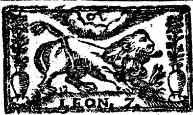
Julio tiene 31. dias, la Luna 30.

1 Sab. S. Casto, y Segundino Mrs. 2 Do. La Visitacion de N. Señora. 3 Lun. S. Trifon, y 12. Comp. Mrs. 4 Ma. S. Laureano Arzob. de Sevilla 5 Mierc. S. Zoa Mart. 6 Juev. S. Lucia Mart. 7 Vie. S. Fermin Ob. y S. Udón Ob. 8 Sab. S. Isabel, Reyna de Portugal. 9 Dom. S. Cyriilo Ob. y Mart. 10 Lun. Santa Rufina, y Segunda, y los 7. hermanos Mrs. 11 Mart. S. Pio Pap. y Mart. y S. Abundio Martyr de Cordoba. 12 Mierc. S. Nabor, y Felix Mrs. y S. Juan Gualberto Abad. 13 Juev. San Anacleto Pap. y M. 14 Vi. S. Buenaventura Ob. y Doct. 15 Sab. S. Henrique Emperador. 16 Dom. El Triunfo de la S. Cruz, y N. Señora del CARMEN. 17 Lun. S. Alexo Conf. 18 Mart. S. Simphorosa, y sus 7. hijos Mrs. y S. Marina Virg. y M. 19 Mier. S. Justa, y Rufina V. y Ms. 20 Juev. S. Elias Profeta, S. Librada, y Margarita Virg. y Mrs. 21 Viern. S. Praxede Virg. 22 Sab. S. Maria Magdalena. 23 Dom. S. Apolinar Ob. y Mart. 24 Lun. S. Chullina Virg. y M. y S. Francisco Solano Conf. Vigilia. 25 Mart. Santiago Apostol, Patron de España, y S. Christoval M. * Merida. 26 Mier. S. Ana, Madre de N. Señora Hay Procecion General. 27 Juev. S. Pantaleon Mart. 28 Vie. S. Victor Pap. S. Nazario, y Celso Mrs. y S. Innocencio P. y C. 29 Sab. S. Marta Virg. S. Felix Pap. Simplicio, Faustino, y Beatrix Ms. 30 Do. San Abdon, y Senen Mrs. 31 Lun. S. Ignacio de Loyola, Fundador de la Compania de Jesus.