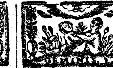
Mayo tiene 31. dias, la Luna 30.

☽ Quart. crec. à las 10. y 40. ms. de la mañ. en Leon. Viento humedo. 26 Mier. S. Clero, y Marcelino Pp. y Mrs. y la Translac. de S. Leocadia. 27 Juev. S. Anastasio Pap. S. Pedro Armengol Mart. y Santo Toribio Arzobispo de Lima. 28 Vi. S. Vidal M. y S. Prudencio Ob. 29 Sab. S. Pedro Mart. 30 Dom. S. Cathalina de Sena Virg. y el Patrocino de S. Joseph.