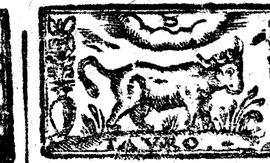
Abril tiene 30. dias, la Luna 29.

☽ Quarto crec. à las 3. y 34. ms. de la tarde, en Cancer. Nubes, viento humedo, y lluvia. 27 Lun. S. Ruperto Ob. y Conf. 28 Mart. S. Castor, y Doroteo Mrs. 29 Mier. S. Eustasio Abad. 30 Juev. S. Juan Climaco Abad. 31 Viern. Los Dolores de N. Señora, y S. Balbina Virg. ✕ Anima.