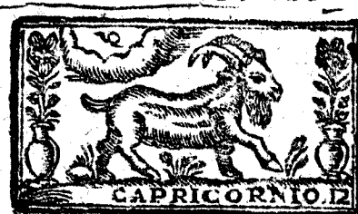
Diciembre tiene 31. dias, la Luna 30.

1 Mierc. La Fiesta de Todos los Santos. * Leon, Piña, y Villa de Yecla. 2 Juev. La Commemoracion de los Difunt. y S. Eustochia V. y M. Jubil. 3 Vier. S. Valentin Presbyt. y M. 4 Mart. S. Florencio Obispo. 5 Dom. San Zacharias Profeta. 6 Lun. S. Leonardo Conf. 7 Mart. S. Florencio Obispo. 8 Mier. S. Severo, y Comp. Mrs. 9 Juev. La Dedicacion de la Iglesia del Salvador, y S. Theodoro M. 10 Vier. S. Trifon, y Comp. Mrs. * S. Estevo. de Gormaz, Cervera, y Manilla. 11 Sab. S. Martin Ob. y Conf. 12 Dom. El Parricidio de N. Señora, S. Martin P. y M. S. Diego de Alcala, y S. Millan Conf. Jubileo. 13 Lun. S. Eugenio, 3. Arzob. de Toledo, y S. Estanislao Koska C. 14 Mart. S. Lorenzo Ob. 15 Mierc. S. Eugenio Arzob. y Patron de Toledo. * Alcalá de Henares. 16 Juev. S. Rufino, y Comp. Mrs. 17 Viern. S. Getrudis la Magna. 18 Sab. S. Maximo Ob. 19 Do. S. Isabel, Reyna de Ungria. 20 Lun. S. Felix de Valois Fundador 21 Ma. La Prefentac. de N. Señora. 22 Mi. S. Cecilia V. y M. Sol en Sagr. 23 Juev. S. Clemente Pap. y Mart. 24 Viern. S. Chryfogono Mart. 25 Sab. S. Cathalina Virg. y Mart. * Guadalaxara, y Castro. Xerix. 26 Do. Los Desposorios de N. Señora, y S. Pedro Alexand. O. y M. 27 Lu. S. Facundo, y Primitivo Ms. 28 Mar. S. Gregorio Papa tercero, y S. Jacome de la Marca Conf. 29 Mi. S. Saturnino Mart. Vigilia. 30 Ju. S. Andrés Ap. * Baex, y Medell.