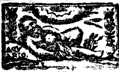
Enero tiene 31. dias, la Luna 30.

JUICIO DEL AÑO. CON magnificos resplandores llega el Principe de las irradiantes antorchas à su dorado Vellochino, para celebrar en su exaltacion gloriosa el cumple años de su Augusto natal, felicitando benévolo al Emisferio Boreal.