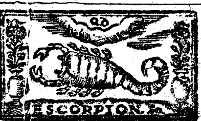
Octubre tiene 31. dias, la Luna 30.

1 Vier. S. Gil Abad, y los Ss. 12. hers. Ms. y S. Vincencio, y Leto. * Soría. SANE LA CANICULA. 2 Sab. S. Estevan, Rey de Ungria. * Palencia. 3 Do. S. Sandalio M. de Cordoba. 4 Lu. S. Candida, Rosa, y Rotalia Vs. 5 Mart. S. Lorenzo Juliano Ob. 6 Mier. S. Eugenio, y Comp. Ms. 7 Juev. S. Regina V. y M. Abstinenc. 8 Viern. La Natividad de N. Señora. * Ocaña, Salamanca, Alcazar de San Juan, Xadraque, Guadalupe, y Navacalar. 9 Sab. S. Gorgonio Mart. 10 Do. El Dulce Nombre de MARIA, y S. Nicolas de Tolentino C. 11 Lun. S. Protó, y Jacinto Mrs. 12 Mart. S. Leoncio, y Comp. Mrs. 13 Mierc. S. Phelipe Mart. 14 Ju. La Exaltacion de la S. Cruz. * Casarrub. Zalamea, Villa de Bribuega, y San Clemente de la Mancha. 15 Vier. S. Nicomedes Mart. 16 Sab. S. Cornelio, y Cypriano Pontifices, y Mrs. 17 Dom. Las Llagas de S. Francisco, y S. Pedro de Arbués. 18 Lun. S. Thomas de Villan. Ob. 19 Mart. S. Genaro Ob. y Mart. 20 Mier. S. Eustaquio, y Comp. Ms. Vigilia. Tempora. 21 Juev. S. Matheo Apost. y Evang. * Madrid, Ecija, Llerena, Coria, Villena, y Martin. Muñoz. 22 Vi. S. Mauric. y Comp. Ms. Temp. 23 Sab. S. Lino P. y M. y S. Tecla V. y M. Tempora. OTONO. Sol en Libra. 24 Do. N. S. de las Mercedes, Fund. de su Religion, y S. Gerardo. 25 Lun. S. Maria de Socors Virg. 26 Mar. S. Cypriano, y Justina Ms. 27 Mi. S. Cosme, y S. Damian Ms. 28 Juev. S. Uventeslao Mart. 29 Vi. La Dedicac. de S. Miguel Arcang. 30 Sab. S. Geronimo Doctol.