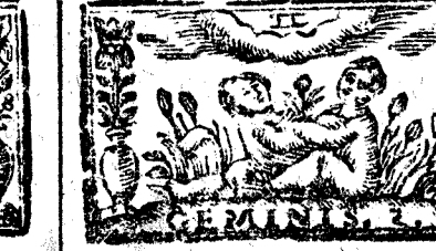
Mayo tiene 31. dias, la Luna 30.

1 Viern. S. Venancio Ob. y Mart. 2 Sab. S. Francisco de Paula, Fundador, y S. Maria Egypciaca. 3 Dom. S. Ulpiano Mart. 4 Lun. S. Ilidoro Arzob. de Sevilla. 5 Mart. S. Vicente Ferrer Conf. 6 Mier. S. Celestino Papa. 7 Juev. S. Epiphano Ob. y Mart. 8 Viern. Los Dolores de N. Señora, y S. Dionysio Ob. * Anima. 9 Sab. S. Maria Cleopha. * Anima. 10 Dom. de Ramos, y San Ezechie. Propheta. Hay Procecion General. 11 Lun. S. Leon Papa, y Conf. 12 Mart. S. Victor Martyr. 13 Mier. San Hermenegildo, Rey de España Mart. 14 Juev. Santo, S. Tiburcio, y Valeriano Mrs. 15 Viern. Santo, S. Basilia, y Anastasia Mrs. 16 Sab. Santo, S. Engracia Virg. y M. 17 Dom. Pascua de Resurreccion, y S. Aniceto Papa, y Mart. 18 Lun. Fiesta, S. Eleuterio Obispo. 19 Mart. Fiesta, San Hermogenes, y Comp. Mrs. 20 Mi. S. Ines V. Sol en Taur. * Anima. 21 Juev. S. Anselmo Obispo. 22 Vi. S. Sotero, y S. Cayo Pp. y Ms. 23 Sab. S. Jorge Mart. Abstinencia. 24 Dom. de Quasimodo, y S. Gregorio Ob. y Conf. Hay Procecion General. Abrense las Velaciones. 25 Lun. S. Marcos Evangelista. Hay Procecion General. * Andujar, Brozas, y Chilochebes. 26 Mart. S. Clero, y M. ccelino Pp. y Mrs. y la Traslacion de S. Leocadia. 27 Mier. S. Anastasio Pap. S. Pedro Armengol Mart. y Santo Toribio Arzobispo de Lima. 28 Ju. S. Vidal M. y S. Prudencio Ob. 29 Viern. S. Pedro Mart. 30 Sab. S. Cathalina de Sena Virg.