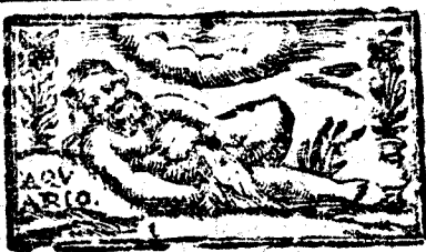
enero tiene 31. dias, la Luna 30.

JUICIO DEL AÑO. Con el gyro de su proprio movimiento forma el Sol las quatro Estaciones del Año; y de ellas la primera, en opinion de los Astrologos, es la florida Primavera, cuyo principio será dia 20. de Marzo a las 2. y 42. ms. de la tarde, tiempo en que entra el Sol