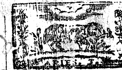
Marzo tiene 31. dias, la Luna 30.

1 Mart. S. Ignacio Ob. y M. y S. Brigida Virg. Abstinencia. 2 Mier. La Purificacion de N. Señora. Hay Procecion General. 3 Juev. S. Blas Ob. y Mart. 4 Viern. S. Andres Corsino Ob. 5 Sab. S. Agueda Virg. y Mart. 6 Dom. Santa Dorothea Virg. y M. 7 Lun. S. Rom ualde Abad, y S. Ricardo, Rey de Inglaterra. 8 Mar. S. Juan de Mara F. * Merida. 9 Mier. S. Polonia Virg. y Mart. 10 Juev. S. Escolastica V. y S. Guillermo, Gran Duque de Aquitania. 11 Vier. S. Saturnino, Presbytero, y Mart. * Ferlanga. 12 Sab. S. Olalla de Barcelona, y S. Mart. 13 Dom. de Septuagesima, y S. Benigno Mart. * Anima. 14 Lun. S. Valentin Presb. y Mart. 15 Mart. S. Faustino, y Jovite Mrs. 16 Mier. S. Julian, y S. Comp. Ms. * Medina del Campo. 17 Juev. S. Julian de Capadocia M. 18 Viern. S. Eladio, Arzob. ispo de Toledo, y S. Simeon Ob. y Mart. Sol en Piscis. 19 Sab. S. Gavino Presbyt. y M. 20 Dom. S. Leon Obispo. 21 Lun. S. Felix Obispo. 22 Mart. La Cathedra de S. Pedro en Antiochia, y S. Pafcasio Ob. 23 Mier. Santa Marta Virg. y Mart. y S. Florencio Conf. Vigilia. 24 Juev. S. Matias Apostal. Jubileo. * Tendilla. 25 Viern. S. Cefarino Conf. 26 Sab. S. Alejandro Obispo. 27 Dom. S. Baldemero Conf. 28 Lun. S. Roman Abad. 29 Mier. S. Eusebio Ob. y Mart. 30 Mart. S. Eusebio Ob. y Mart. 31 Juev. S. Eusebio Ob. y Mart.