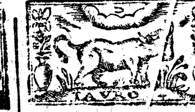
Abril tiene 30. dias, la Luna 29.

1 Ma. El S. Angel de la Guarda, y S. Rosendo Ob. y C. * Guadaluara. 2 Mier. de CENIZA, y S. Lucio Ob. y Comp. Mrs. 3 Ju. S. Hemeter, y S. Celedonio Ms. Cierranse las Velaciones. 4 Viern. S. Calimiro Conf. 5 Sab. S. Eusebio, y Comp. Ms. 6 Dom. S. Victor, y Comp. Mrs. 7 Lun. S. Thomas de Aquino Doct. y S. Perpetua, y Felicitas Mrs. 8 Mar. S. Julian Arzob. de Toledo, y S. Juan de Dios, Fund. * Anim. 9 Mier. S. Francisca Viud. S. Paciano Ob. y S. Cathalina de Bolonia V. Tempora. 10 Ju. S. Meliton, y 39. Comp. Ms. 11 Vier. S. Eulogio Mart. Tempora. 12 Sab. S. Gregorio Papa. Tempora. 13 Do. S. Leandro Arzob. de Sevilla, y S. Rodrigo, y Salomon Mrs. 14 Lun. S. Matilde Reyna. 15 Mart. S. Longinos Mart. 16 Mier. S. Julian Mart. 17 Juev. S. Patricio Ob. y Conf. 18 Viern. S. Gabriel Archangel. 19 Sab. San Joseph, Esposo de N. Sra. * Anima. 20 Do. S. Joachin, Padre de N. Señora. * Anima. 21 Lun. S. Benito Abad, Fundador. 22 Mart. S. Deogracias Obispo. 23 Mier. S. Victoriano, y Comp. Ms. 24 Juev. S. Agapito Obispo. 25 Viern. La Anuncion de N. Señora, y Encarnacion del Hijo de Dios, y el Buen Ladrón. 26 Sab. S. Braulio Ob. de Zaragoza. 27 Do. S. Ruperto Ob. y C. * Anim. 28 Lun. S. Castor, y Doroteo Mrs. 29 Mart. S. Eustasio Abad. 30 Mier. S. Juan Climaco Abad. 31 Juev. S. Sabina Virg.