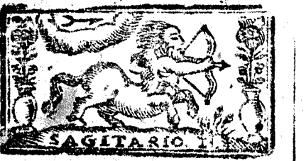
Noviembre tiene 30. dias, la Luna 29