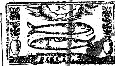
Febrero tiene 28. dias, la Luna 29.

1 Sab. La Circuncision del Señor. 2 Dom. S. Idoro Ob. y Mart. 3 Lun. S. Antero Papa, y Mart. 4 Mart. S. Aquilino, y Comp. Mrs. 5 Mier. S. Teletphoro Pap. y Mart. 6 Jue. La Adoracion de los Santos Reyes. 7 Viern. S. Julian Martyr. 8 Sab. S. Luciano, y Compan. Ms. 9 Dom. S. Julian, y Basilita Mrs. 10 Lun. S. Nicamor, Diacono, y Mart. 11 Mart. S. Hyginio Pap. y Mart. 12 Mier. S. Benito Abad, y Conf. 13 Juev. S. Gumerindo Conf. 14 Viern. S. Hilario Obisp. y Conf. 15 Sab. S. Pablo, primer Ermitaño, y S. Mauro Abad. 16 Dom. El Dulce Nombre de JESUS, S. Marcelo Pap. y Mart. y S. Fulgencio Obisp. y Conf. 17 Lun. S. Antonio Abad. 18 Mart. La Cathedra de S. Pedro en Roma, y S. Prisca Virg. y M. 19 Mi. S. Canuto, Rey de Dinamarca, y S. Mario, y Comp. Ms. Abstinencia. 20 Juev. S. Fabian, y S. Sebastian Ms. Hay Procecion Gener. Sol en Aquario. 21 Viern. S. Ines Virg. y Mart. 22 Sab. S. Vicente, y Anastasio Ms. 23 Do. S. Ildefonso, Arzob. de Toledo, y S. Raymundo de Peñafort Conf. 24 Lun. N. Señora de la Paz, y San Timotheo Obisp. y M. 25 Mar. La Conversion de S. Pablo. 26 Mier. S. Policarpo Ob. y Mart. 27 Jue. S. Juan Chrisostomo O. y C. 28 Vier. S. Julian Ob. de Cuenca, y Aparicion de S. Ines, y S. Valero Ob. 29 Sab. S. Francisco de Sales O. y C. 30 Dom. Santa Martina Virg. y M. 31 Lun. S. Pedro Nolasco Fundad.