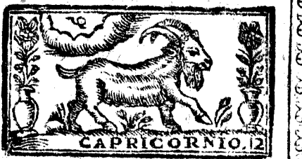
Diciembre tiene 31. dias, la Luna 30