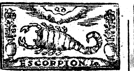
Octubre tiene 31. dias, la Luna 30.