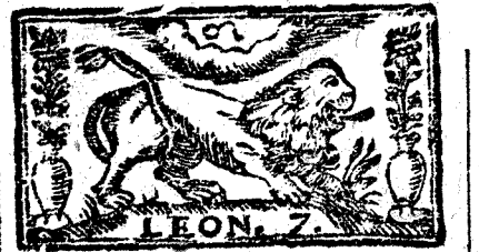
Junio tiene 31. dias, la Luna 30.