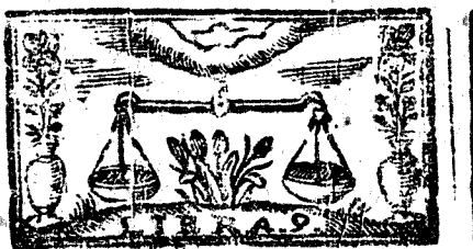
Septiembre tiene 30. dias, la Luna 30.