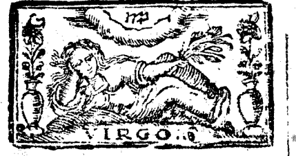
Agofo tiene 31. dias, la Luna 30.