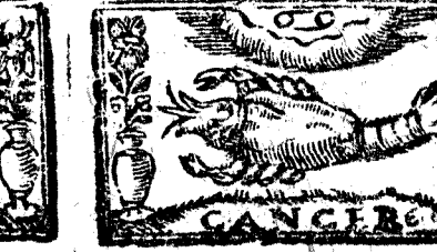
Junio tiene 30. dias, la Luna 29.

1 Do. S. Phelipe, y Santiago, Apostoles. * Medelín, y Coria. 2 Lun. S. Athanasio Ob. y Conf. 3 Mar. La Invencion de la Santa Cruz. 4 Mier. Santa Monica Viuda. 5 Juev. S. Pio V. Papa, y Conf. 6 Vier. SAN JUAN ANTE PORTAM-LATINAM. 7 Juev. S. Eitanislaio O. y M. Abstinencia. 8 Dom. La Aparicion de S. Miguel, y el Patrocinio de S. Joseph. Hay Procecion General. 9 Lu. S. Gregorio Nacianceno Ob. 10 Ma. S. Antonino, Arzobisp. y C. 11 Mier. S. Mamerto Obispo. 12 Ju. S. Domingo de la Calzad. C. 13 Viern. S. Pedro Regalado Conf. 14 Juev. Santo, S. Tiburcio, y Valeriano Mrs. 15 Viern. Santo, S. Basilia, y Anastasia Mrs. 16 Sab. Santo, S. Engracia Virg. y M. 17 Dom. Pascua de Resurreccion, y S. Aniceto Papa, y Mart. 18 Lun. Fiesta, S. Eleuterio Obispo. 19 Mart. Fiesta, San Hermogenes, y Comp. Mrs. 20 Mi. S. Ines V. Sol en Taur. * Anima. 21 Juev. S. Anselmo Obispo. 22 Vi. S. Sotero, y S. Cayo Pp. y Ms. 23 Sab. S. Jorge Mart. Abstinencia. 24 Dom. de Quasimodo, y S. Gregorio Ob. y Conf. Hay Procecion General. Abrense las Velaciones. 25 Lun. S. Marcos Evangelista. Hay Procecion General. * Andujar, Brozas, y Chilochebes. 26 Mart. S. Clero, y M. ccelino Pp. y Mrs. y la Traslacion de S. Leocadia. 27 Mier. S. Anastasio Pap. S. Pedro Armengol Mart. y Santo Toribio Arzobispo de Lima. 28 Ju. S. Vidal M. y S. Prudencio Ob. 29 Viern. S. Pedro Mart. 30 Sab. S. Cathalina de Sena Virg.