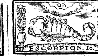
ESCORPION. 10. Octubre tiene 31. dias, la Luna 29.