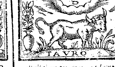
Abril tiene 30. dias, la Luna 29.