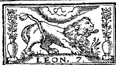
LEON. 7. Julio tiene 31. dias, la Luna 30.