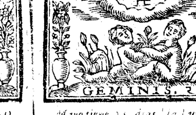
Mayo tiene 31. dias, la Luna 30.