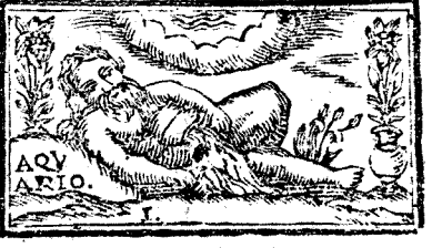
Enero tiene 31. dias, la Luna 30.

ECLIPSES DE SOL, Y LUNA. POR exacto computo Astronomico en este Año, se numeran cinco Eclipses, tres de Sol, y dos de Luna. El primero será de Sol, dia 13. de Abril, a las 1. y 45. ms. de la mañana; no será visible en nuestras Regiones, ni en Climmas Septentrionales. El segundo será de Luna, dia 27. de Abril, a las 8. y 35. ms. de la mañana, será Eclipse total, y no visible en Europa; pero si en la America. El tercero será de Sol, dia 12. de Mayo; no será visible en nuestras Regiones; pero en la Noruega, será visible. El quarto será de Sol, dia 6. de Octubre, a las 6. y 22. minutos de la mañana; no será visible en la Europa. El quinto será de Luna, dia 21. de Octubre, será total, y visible: empezará a las 5. de la tarde, estando la Luna debaxo del Horizonte; pero a las 5. y 23. ms. se verá salir eclipsada, y perderá totalmente la luz a las 5. y 58. ms. El medio del Eclipse será a las 6. y 49. ms. Empezará la Luna a recuperar la luz a las 7. y 39. ms. El fin del Eclipse