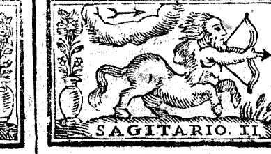
SAGITARIO. 11. Noviembre tiene 30. dias, la Luna 30.