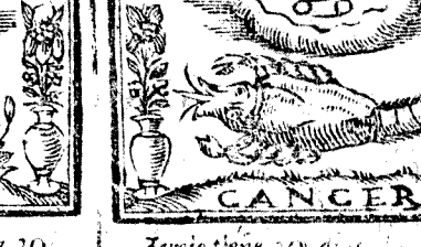
Junio tiene 30. dias, la Luna 29.