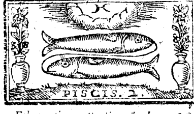
Febrero tiene 28. dias, la Luna 29.