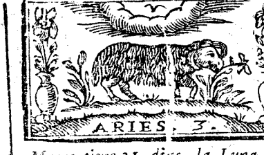
Marzo tiene 31. dias, la Luna 30.