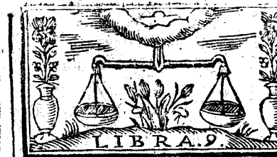
LIBRA. 9. Septiembre tiene 30. dias, la Luna 30.