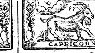
CAPRICORNIO. 12. Diciembre tiene 31. dias, la Luna 29.