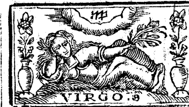
VIRGO. 8. Agosto tiene 31. dias, la Luna 30.