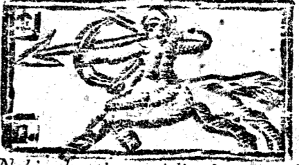
Noviembre tiene 30. dias, la Luna 29.