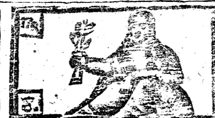
Agosto tiene 31. dias, la Luna 30.

27 Juev. f. Pantaleon m. 28 Quarto creciente a las 12. y 18. ms. de la noche en Escorpio, rebuelto. 29 Vier. f. Nazario, Ceiso, Vito. P. y mrs. y f. Inocencio P. v. Conf. 30 Sab. f. Marta, y los S. Felix. P. Simplic. Faust. y Beatr. ms. y f. Lupo O. 31 Dom. f. Abdon, y Senenf. mrs. 32 Lun. f. Ignacio de Loyola Fundador.