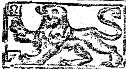
Julio tiene 31. dias, la Luna 30.

1 Sab. f. Caslo, y Secundino Ob. 2 Dom. la Visitation de N. S. y san Proc. fo, y Martiniano, mrs. 3 Lun. f. Marcos, y comp. mrs. 4 Mart. f. Isabel Reyna de Portugal, y f. Laureano Arg. de Sevilla m. 5 Mier. f. Zoa m. 6 Juev. f. Lucio mart. 7 Luna llena a las 9. y 24. ms. de la mañana en Capricornio, truenos. 8 V. f. f. Fermin, y f. Claudio mart. 9 Sab. f. Isabel Reyna, y f. Agueda, y Felicita mart. 10 Dom. S. Cirilo Ob. y mart. 11 Lun. f. Rufina, y segunda, y los 7. hermanos Martires. 12 Mier. f. Pío Pap. y m. 13 Mier. f. Mar. V. y m. y f. Juan Gualvert. Ab. f. Nabor, v. S. Felix mrs. 14 Juev. f. Anacleto Pap. y m. 15 Quarto meng. a las 2. y 30. ms. de la tarde en Aries, viento, y nubes. 16 Vier. f. Buenaventura Cardenal. 17 Sab. f. Enrique, y f. Anastasio. 18 Dom. el Triunfo de la f. X. y N. Señora de l Camen. 19 Lun. f. Alexo Conf. 20 Mart. f. Siforosa, y 7. hijos mrs. 21 Mier. f. Justa, y Rufina v. m. 22 Luna nueva a las 9. y 43. ms. de la mañana en Leo, calor, y truenos. 23 Juev. f. Elias Prof. y f. Librada, y f. Marg. Virg. y m. 24 Vier. f. Praxedi v. 25 Sab. f. María Magdalena. 26 Dom. f. Apolinar Ob. y m. 27 Lun. f. Christina V. y m. Vigil. 28 Mart. Sauting. Apof. Patron de España, y f. Christoval matt.