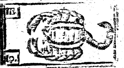
Octubre tiene 31. dias, la Luna 30.

24 Dom. N. Señora de las Mercedes, Fundad. de su Religio, y f. Gerardo. 25 Lun. f. Maria Socors V. y f. Cleofa. 26 Quarto creciente a las 8. y 20. ms. de la mañana en Capricornio, fresco en partes. 27 Mar. f. Cipriano, y f. Justina mrs. 28 Mier. f. Cosme, y f. Damian mrs. 29 Juev. f. Vencislao Duq. de Roer. 30 Vier. La Dedicacion de S. Miguel Arcangel. * Valladolid, Zafra, y Ubeda. 31 Sab. f. Gerónimo Doct. de la Iglesia.