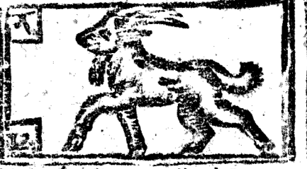
Diciembre tiene 31. dias, la Luna 30.