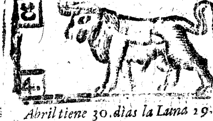
Abril viene 30 dias la Luna 29.

1. Juev. f. Venancio Ob. y mart. 2. Vier. f. Francisco de Paula, y S. Maria Egypciaca. 3. Sab. f. Vlpiano mart. 4. Dom. de Quasimodo, y f. Isidoro Arzobispo. Ay procession general. 5. Absinencia. 6. Luna nueva a las 9. y 20. ms. de la mañana en Aries, lluvia. 7. Mart. f. Celestino Papa, y mart. 8. Mier. f. Ciriaco, y comp. mrs. 9. Juev. f. Dionisio Ob. 10. Vier. f. Catalda Virg. 11. Sab. f. Ezequiel profeta. 12. Dom. f. Leon Papa. 13. Lun. f. Leon Ob. 14. Quarto creciente a las 12. y 40. ms. del día en Cancer, calor, y viento. 15. Mar. f. Ermeng Rey de Esp. 16. Mier. f. Tiburcio, y comp. mrs. 17. Juev. f. Basilia, y Anastasia V. 18. Vier. f. Ingracia V. y m. 19. Sab. f. Aniceto Pap. y m. 20. Dom. f. Eleuterio Ob. y mart. 21. Lun. f. Eusebio Ob. y mart. 22. Mart. f. Inés Virg. 23. Luna llena a las 10. y 52. ms. de la mañana en Libra, truenos, y granizo. 24. Mier. f. Anselmo Arzob. y f. Simon, y comp. mrs. 25. Juev. f. Sotero, y f. Cayo. P. 26. Vier. f. Jorge martir. 27. Sab. f. Dima, y f. Greg. O. y C. Absinencia. 28. Dom. f. Marcos, Evangelista. Ay Procession general. 29. Andujar, Brozas, y Chiloeches. 30. Lun. f. Cleto, y Marc. PP. v mrs. y la transacion de f. Leocadia. 31. Mart. f. Anastasio Papa, y m. y f. Pedro Armengal m. y Beato Toribio. Arzob. de Lima. 32. Quarto menguante a las 11. y 5. ms. de la noche en Capricornio, lluvia, y viento. 33. Mier. f. Vidal. m. y f. Prudente. O. 34. Juev. f. Pedro Martyr. 35. Vier. f. Catalina de Sena V.