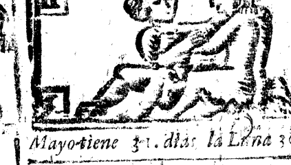
Mayo viene 31 dias la Luna 30.

1. Juev. f. Venancio Ob. y mart. 2. Vier. f. Francisco de Paula, y S. Maria Egypciaca. 3. Sab. f. Vlpiano mart. 4. Dom. de Quasimodo, y f. Isidoro Arzobispo. Ay procession general. 5. Absinencia. 6. Luna nueva a las 9. y 20. ms. de la mañana en Aries, lluvia. 7. Mart. f. Celestino Papa, y mart. 8. Mier. f. Ciriaco, y comp. mrs. 9. Juev. f. Dionisio Ob. 10. Vier. f. Catalda Virg. 11. Sab. f. Ezequiel profeta. 12. Dom. f. Leon Papa. 13. Lun. f. Leon Ob. 14. Quarto creciente a las 12. y 40. ms. del día en Cancer, calor, y viento. 15. Mar. f. Ermeng Rey de Esp. 16. Mier. f. Tiburcio, y comp. mrs. 17. Juev. f. Basilia, y Anastasia V. 18. Vier. f. Ingracia V. y m. 19. Sab. f. Aniceto Pap. y m. 20. Dom. f. Eleuterio Ob. y mart. 21. Lun. f. Eusebio Ob. y mart. 22. Mart. f. Inés Virg. 23. Luna llena a las 10. y 52. ms. de la mañana en Libra, truenos, y granizo. 24. Mier. f. Anselmo Arzob. y f. Simon, y comp. mrs. 25. Juev. f. Sotero, y f. Cayo. P. 26. Vier. f. Jorge martir. 27. Sab. f. Dima, y f. Greg. O. y C. Absinencia. 28. Dom. f. Marcos, Evangelista. Ay Procession general. 29. Andujar, Brozas, y Chiloeches. 30. Lun. f. Cleto, y Marc. PP. v mrs. y la transacion de f. Leocadia. 31. Mart. f. Anastasio Papa, y m. y f. Pedro Armengal m. y Beato Toribio. Arzob. de Lima. 32. Quarto menguante a las 11. y 5. ms. de la noche en Capricornio, lluvia, y viento. 33. Mier. f. Vidal. m. y f. Prudente. O. 34. Juev. f. Pedro Martyr. 35. Vier. f. Catalina de Sena V.