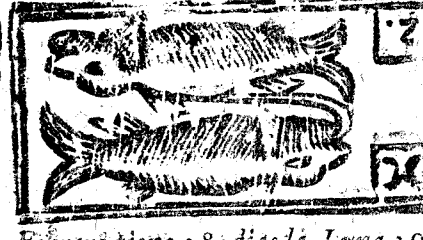
Febrero viene 28 dias la Luna 29.