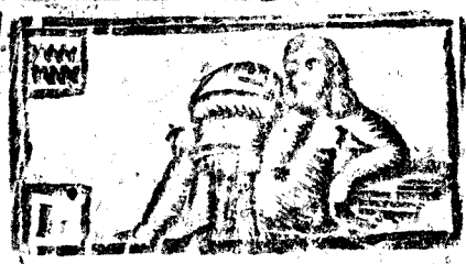
Enero viene 31 dias la Luna 30.

Inycción del Año. Empezará el año Civil en el primer día de Enero, y es en el día que da principio al año nuestra Santa Madre Iglesia Católica Romana para la celebridad de las Santas Fiestas fixas, y las movibles, tendrá su cuenta desde el día 6. de Março, que es quando sucede la conjunción de Sol, y Luna, y esse día da principio la Luna de Março, porque la Pasqua es a 28 del mesmo mes. La cuenta Astrologica empezará a 21. de Março a las 3. y 38. ms. de la mañana, y dará principio la alegre Primavera, y entra el Sol en la primera línea de la casa del vecino Marte. En este punto haze por el Oriente Regio de la Coronada Villa de Madrid el Primer decano de Acuario, y en el medio Cielo se halla el vecino de Escorpio. Saturno en fin de Sagitario en la 11. ca-