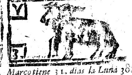
Março viene 31 dias la Luna 30.