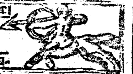
Noviembre tiene 30 dias la Luna 29.

1 Dom. Todos los Santos. * Leon. Pina, y Villa de Yecla.