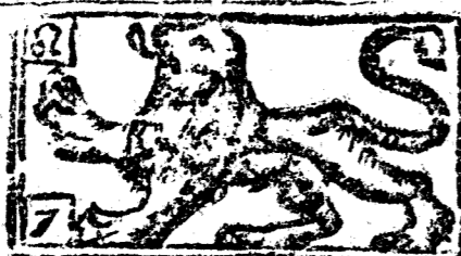
Julio tiene 31 dias la Luna 30.

Con Privilegio del Rey N. Señor (que vive Geronimo Estrada) y de los Señores de Real Consejo, que se hallaron a seis marcos cada pliego, se hallarán en la calle de la Coquera