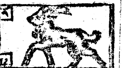
Diciembre tiene 31 dias la Luna 30.