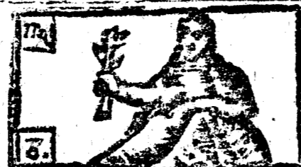
Agosto tiene 31 dias la Luna 30.

1 Sab. f. Pedro Advincula, y los 7. hermanos Macabeos mart.