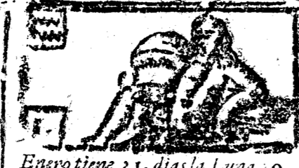
Enero tiene 31. dias la Luna 30.

Inycción del Año. Empezará en Jueves, día 1. de Enero, según la cuenta de N. S. Madre Iglesia y darán principio las quantas Civiles. El año Atholológico empezará a 20. de Marzo a las 9. y 59. ms. de la tarde, tiempo en que el brillante Apolo llega a pisar la primera linea de la superficie concava del signo de Aries, casa del velico Marte, y en este instante asciendo por el Orizonte regio de Madrid el 2. Ducano de Escorpio, y en el medio Cielo se halla el vltimo de Leo. Saturno se halla en Sagitario, y en la 2. retrogrado. Júpiter se halla en Sagitario, y en la 1. retrogrado. Marte se halla en la 8. y en Geminis. El Sol se halla en la 5. en Aries. Venus se halla en la 4. y en Piteis. Mercurio se halla en la 5. retro-