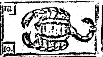
Octubre tiene 31 dias la Luna 30.

Luna nueva a las 1. y 49. ms. de la mañana en Aries, tiempo vario.