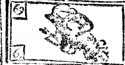
Junio tiene 30 dias, la Luna 29.

1 Mier. S. Phelipe, y Santiago Apòst. * Medellin, y Coria. 2 Iuev. f. Atanasio Ob. y Conf. 3 Vier. La Inuencion de la f. Cruz. 4 Sab. f. Monica Viuda. 5 Dom. la Corona de Espinas, y f. Pio. 6 Lun. f. Iuan Ante-Portalatina Abf. 7 Mart. f. Estanislao Ob. y mart. LETANIAS. 8 Iuev. f. Pedro, y comp. marts de Cordova. 9 Dom. f. Feliciano, y Primos. ms. 10 Lun. f. Christo, y Restituto. y f. Margarita Reyna. 11 Mart. f. Bernabè Apòstol. * Caceres. 12 Mier. f. Basilide, y comp. m. mrs. y f. Iuan de Sahagun Conf. 13 Iuev. f. Antonio de Padua C. 14 Vier. f. Basilio Magno Conf. 15 Sab. f. Victor, y comp. mart. 16 Dom. f. Quirico, y Iulia mas. 17 Lun. f. Manuel, y comp. marts. 18 Mart. f. Ciriaco, Paula, Marco, y Marcelino, martyres. 19 Mier. f. Gervasio, y Protasio ms. 20 Iuev. f. Silverio Papa, y mart. 21 Vier. f. Eusebio Ob. y mart. y B. Luis Gonzaga Conf. ESTIO. 22 Sab. f. Paulino Ob. y Conf. Vig. 23 Dom. f. Iuan Bresb. y mart. 24 Lun. San Iuan Bautilla. * Segovia, Leon, Soria, y Zamora. 25 Mar. f. Guillelmo Conf. 26 Mier. f. Iuan, y f. Pablo mart. 27 Iuev. f. Zoylo, y comp. mrs. 28 Vier. f. Leon Papa, y Conf. Vig. 29 Sab. f. Pedro, y S. Pablo Apòst. * Burgos, y Avila. 30 Dom. la Comemor. de f. Pab.