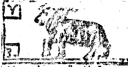
Março tiene 31 dias, la Luna 30.

1 Iuev. f. Ignac. Ob. y f. Brig. Virg. Abstinencia por devocion. 2 Vier. La Purificacion de Nuestra Señora. 3 Sab. f. Blàs Ob. y m. 4 Dom. f. Andrés Corsino Ob. y m. 5 Lun. f. Agueda Virgen. 6 Mar. f. Dorotea Virgen, y m. 7 Mier. f. Romualdo Abad. 8 Iuev. f. Iuan de Mata fund. y f. Pablo Ob. y comp. ms. * Merida. 9 Vier. f. Polonia Virgen, y m. 10 Sab. f. Escolastica Virgen. 11 Dom. f. Saturnino Presb. y comp. martyres. * Verlanga. 12 Lun. f. Olalla Virgen, y mart. y la primera translacion de S. Eugenio. 13 Mar. f. Benigno Martyr. 14 Miercoles de CENIZA f. Val. Presb. y m. Abolucion general en los conventos de Redepcion de Cauivos... Cierranse las Velaciones. 15 Iuev. f. Faustino, y Iovita. m. 16 Vier. f. Iulian, y comp. m. * Medina del Campo. 17 Sab. f. Iulian de Capadocia m. 18 Do. f. Eladio Arçob. de Toledo, y f. Simon Ob. y martyr. 19 Lun. San Gavino Presbitero. Sol en Piscis. 20 Mart. f. Leon Obispo. Anima. * Tempora. 21 Mier. f. Felix Ob. 22 Iuev. la Catedra de S. Ped. en Antioquia, y S. Pasasio Obispo. * Zamora. 23 Vier. f. Marta virgen, y m. 24 Sab. f. Cesario Tempora. 25 Dom. S. Marias Apòtol. * Tend. 26 Lun. f. Alexandro Ob. 27 Mar. f. Leandro. 28 Mier. f. Roman Abad. 29 Iuev. f. Satoro mart.