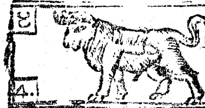
Abril tiene 30 dias, la Luna 29.

1 Vier. El Angel de la Guarda, y f. Leonm. * Guadalaxara. 2 Sab. f. Lucio Ob. * Anima. * 3 Dom. f. Helmeterio, y Celed. * 4 Lun. f. Casimiro Conf. y f. Lucio. 5 Mar. f. Eufebio, y comp. martyr. 6 Mier. f. Victor, y comp. mrs. 7 Iuev. f. Tho. de Aquino. f. Perp. y f. Felicitas marts. 8 Vier. f. Iulian Arz. de Toledo, y f. Iuan de Dios. 9 Sab. f. Francisca Viuda, y f. Cat. de Bolonia Virgen. 10 Do. f. Meliton, y 39. comp. m. 11 Lun. f. Eulogio Presb. y mart. 12 Mar. f. Gregorio Papa. 13 Mier. f. Rodrigo, y Salomon. m. 14 Iuev. f. Matilde Reyna. 15 Vier. f. Longino mart. 16 Sab. f. Iulian m. y f. Patricio Ob. 17 Dom. f. Patricio, Ob. y Conf. 18 Iuev. f. Eleuterio Ob. y mart. 19 Mar. S. Joseph Patriarca. 20 Mier. f. Ioschin Conf. 21 Iuev. f. Benito Abad. 22 Vier. f. Teograc. Ob. y los Dolores de N. Señora. Anima. * Puenca del Arçobispo. 23 Sab. f. Victor, y cop. m. Anima * 24 Dom. de Ramos. f. Agap. 25 Lun. La Anuaziacion de N. Señora, y Encarnacion del Hijo de Dios. 26 Mar. f. Montano y Maxima m. 27 Mier. f. Ruperto Ob. 28 Iuev. f. Casto, y Doroteo mrs. 29 Vier. f. Segundo mart. 30 Sab. f. Iuan Climaco Abad. 31 Dom. de Pasqua de Resurreccion y f. Balbina Virg.