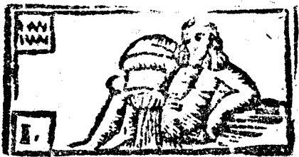
Enero tiene 31 dias, la Luna 30.

Luz del Año. Continuando el tiempo en el movimiento de los Astros, valiendonos del Sol para señalarlo, pues con él se hallan las cuentas mas iguales, así civiles, y Eclesiasticas: para dar principio al año tendrá su entrada en Lunes, dia primero de Enero, siendo el dia en que dá principio las cuentas, segun el estubo de N. S. Madre la Iglesia para las fiestas fixas, y las movibles. Tendrán su principio, y cuenta en 9. de Marzo a la vna y 22. ms. de la mañana. Ora en que entra la Luna nueva de Março, ò Pasqual, El año Astronomico comenzará el dia 20. de Março a las 10. y 22. ms. de la mañana, tiempo en que el velicoso Marte presenta su cara al luciente Apolo, Rey de todos los Astros, y en este instante sube por el Horizonte de Madrid el vltimo Decano de Geminis.