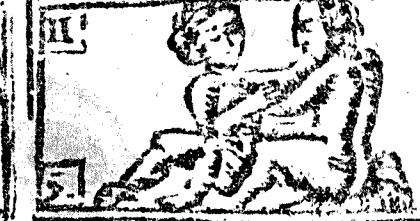
Mayo tiene 31 dias, la Luna 30.

1 Lun. f. Benancio Ob. y mart. Fiesta Egypciaca. Fiesta. 2 Mar. f. Francis. de Paul. y f. Maria. 3 Mier. f. Vlpiano mart. Anima. * 4 Iuev. f. Ilidoro Arçobispo. de Sevilla. 5 Vier. f. Vicente Ferrer, Predicador. 6 Sab. f. Celestino Papa, y mart. 7 Dom. de Quasimoda, y f. Ciriaco, y compañeros martyres. 8 Lun. f. Dionisio Ob. 9 Mart. f. Casilda Virgen. 10 Mier. f. Ezequiel Profeta. 11 Iuev. f. Leon Papa. 12 Vier. f. Leon Obispo. 13 Sab. f. Ermenegildo Rey de Esp. 14 Dom. f. Tiburcio, y comp. mart. 15 Lun. f. Basilisa, y Anastasia Virgs. 16 Mart. f. Encracia Virg. y mart. 17 Mier. f. Aniceto Papa, y mart. 18 Iuev. f. Eleuterio Ob. y mart. 19 Vier. f. Ermozenes mart. 20 Sab. f. Inés Virgen. Sol en Tauro. 21 Dom. f. Anselmo Arçob. f. Simon y comp. marts. 22 Lun. f. Sotero, y f. Cayo Papa, y m. 23 Mart. f. Iorge m. 24 Mier. f. Dimas y f. Greg. O. y Còf. 25 Iuev. f. Marcos Evangelista. 26 Vier. f. Cleto, y Marcelino PP. y ms. y la Traslacion de f. Leocadia. 27 Sab. f. Anastasio Papa, y f. Pedro Armengol, m. y Beato Torib. Arçobispo de Lima. 28 Dom. f. Vidal mart. y f. Prudec. O. 29 Lun. f. Pedro Martyr. 30 Mart. f. Catalina de Sena Virgen.