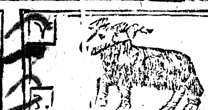
Março tiene 31 dias, la Luna 30.

1 Lun. f. Ignacio Ob. y mart. y santa Brigida Virgen. Abstinencia por devocion. 2 Mart. La Purificacion de N. Señora. Ay Proccesion general. 3 Mier. f. Blas Obisp. y m. 4 Iuev. f. Andrés Corfino Ob. 5 Vier. f. Agueda Virg. y m. 6 Sab. f. Dorotea Virg. y m. 7 Dom. f. Romualdo Abad. 8 Lun. f. Iuan de Mata Fund. y f. Pablo Obispo, y comp. ms. * Merida. 9 Mart. f. Polonia Virg. Luna nueva a las 7. y 2. ms. de la mañana, en Escorp. lluvia. 10 Mier. f. Escolastica Virg. CENIZA. Cierranse las Velaciones. Absolucion general en los Conventos de Redempcion de Cautivos. 11 Iuev. f. Saturnino Presb. y comp. martyres. * Verlanga. Luna nueva a las 11. y 2. ms. de la mañana, en Aquario, viento recio. 12 Vier. f. Olalla Virg. y m. y la primera Translacion de f. Eugenio. 13 Sab. f. Benigno m. 14 Dom. f. Valentin Presbytero, y martyr. 15 Lun. f. Faustino, y Iovita mars. 16 Mart. f. Iulian, y comp. ms. Anima. * Medina del Campo. 17 Mier. f. Iulian de Capadocia. m. Tempora. 18 Iuev. f. Eladio Arçob. de Toledo, y f. Simon Obispo, y m. Sol en Píscis. 19 Vier. f. Gabino Presbyt. Tempora. 20 Sab. f. Leon Obispo. Tempora. 21 Dom. f. Felix Obispo. 22 Lun. la Cathedra de f. Pedro en Antioquia, y f. Pascasio. Obispo. * Zamora. 23 Mart. f. Marta Virg. y m. Vigilia. 24 Mier. f. S. Marias Apostol. * Tend. 25 Iuev. f. Cefario Conf. Luna llena a las 2. y 20. ms. de la tarde, en Virgo, y niev. lluvia. 26 Vier. f. Alexandro Obispo. 27 Sab. f. Leandro. * Anima. * 28 Dom. f. Roman Abad. Anima *