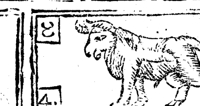
Abril tiene 30 dias, la Luna 29.

1 Lun. El Angel de la Guarda, y san León, y comp. mrs. * Guad alaxara. Ocarraca. 2 Mart. f. Leticio Obispo. 3 Mier. f. Hea actrioy. Celed. ms. 4 Iuev. f. Casimiro Conf. y f. Lucio ms. 5 Vier. f. Eusebio, y comp. ms. 6 Sab. f. Victor, y comp. mrs. 7 Dom. f. Tomas de Aquino, f. Perp. y f. Felicitas mrs. Anima. * 8 Lun. f. Iulian Arçobispo de Toledo, y f. Iuan de Dios Conf. 9 Mart. f. Francisca Viuda Romana. 10 Mier. f. Mediton, y 39. comp. mrs. 11 Iuev. f. Eulogio Presb. y m. 12 Vier. f. Gregor. Pap. y Conf. 13 Sab. f. Gregorio, y Salomon mrs. Luna nueva a las 3. 15. ms. de la mañana, en Píscis reb. con alg. fresc. 14 Dom. f. Maude Reyna. 15 Lun. f. Louginos m. 16 Mart. f. Iulian m. y f. Patricio Ob. 17 Mier. f. Patricio Ob. y Conf. 18 Iuev. f. Gabriel Arcang. y f. Narci. 19 Vier. Los Dolores de N. Señora y S. Joseph Patriarca. Anima. * Ay visita general de Coreeles 20 Sab. f. Joseph Conf. Anima. * Ay Proccesion General. PRIMAVERA. Sol en Aries. 21 Dom. f. Rasmus, f. Benito Abad. 22 Lun. f. Deogracias Ob. * Puente del Arçobispo. 23 Mart. f. Victoriano, y comp. mrs. 24 Mier. f. Agapito Ob. Abstinencia. 25 Iuev. La Anuncion de N. Señora, y Encarnacion del Hijo de Dios. 26 Vier. f. Montano, y Maxima mrs. 27 Sab. f. Ruperto Ob. y Conf. Luna llena a las 2. y 24. ms. de la mañana, en Virgo, y eclipse visible, y se eclipsará a la media llv. y niev. 28 Dom. de Pasqua de Resurreccion. 29 Lun. f. Segundo m. Fiesta. 30 Mart. f. Iuan Climaco Ab. Fiesta. 31 Mier. f. Balbina Virg. Anima *