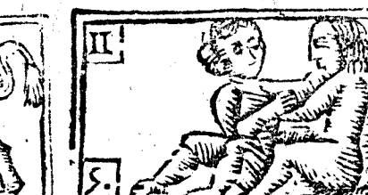
Mayo tiene 31 dias, la Luna 30.

1 Iuev. f. Venancio Ob. y m. 2 Vier. f. Francisco de Paula, y santa Maria Egeyptiaca. 3 Sab. f. Vlpiano m. 4 Dom. de Quasimodo, y f. Ilidoro Arçobispo. de Sevilla. Abrense las Velaciones. 5 Lun. f. Vicente Ferrer Predicador. 6 Mart. f. Celestino Pap. y m. 7 Mier. f. Cirico, y comp. mrs. 8 Iuev. f. Dionisio Ob. 9 Vier. f. Catalda Virg. 10 Sab. f. Ezequiel Profeta. 11 Dom. f. Leon Pap. Luna nueva, y eclipse no visible a las 4. y 2. ms. de la tarde, en Aries templado, y Sol. 12 Lun. f. Leon Obispo. 13 Mart. f. Ermenegildo Rey de España. 14 Mier. f. Tiburcio, y comp. ms. 15 Iuev. f. Basilia, y Anastasia Virg. y martyres. 16 Vier. f. Engracia Virg. y m. 17 Sab. f. Aniceto Pap. y m. 18 Dom. f. Eleuterio Ob. y m. 19 Lun. f. Hermogenes martir. 20 Mar. f. Inés Virgen. Sol en Tauro. 21 Mier. f. Anselmo Arçob. f. Simon, y compañeros mrs. 22 Iuev. f. Sotero, y f. Cayo Pap. y m. 23 Vier. f. Iorge m. 24 Sab. f. Dimas el buen Ladron, y f. Gregorio Ob. y Cof. Abstinencia. 25 Dom. f. Marcos Evangelista. Ay Proccesion general por voto. * Andujar, Brozas, y Chiloeches. Luna llena a las 3. y 26. ms. de la tarde, en Escorpio, viento frio. 26 Lun. f. Cleto, y Marcelino PP. y ms. y la Traslacion de f. Leocadia. 27 Mart. f. Anastasio Pap. y f. Pedro Armengol m. y B. Toribio Arçobispo de Lima. 28 Mier. f. Vidal m. y f. Prudenc. Ob. 29 Iuev. f. Pedro martyr. 30 Vier. f. Catalina de Sena Virg.