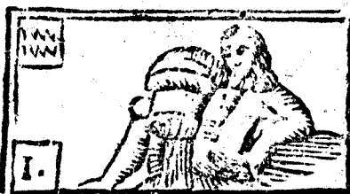
Enero tiene 31 dias, la Luna 29.