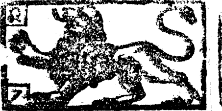
Julio tiene 31 dias, la Luna 30.

Estando la Luna en estos signos es buena, à mala la purga, y sanquia, governan dote segun va puesto. PVRGAS. SANGRIAS. Aries. Mala. Buena.