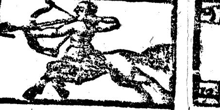
Noviembre tiene 30 dias, la Luna 29

22 Lun. f. Genar. Obispo, y comp. ms. 23 Mart. f. Eustaq. y comp. ms. Vigilia. * Madrid. Ecija. Llerena, y Carrion. Tempora.