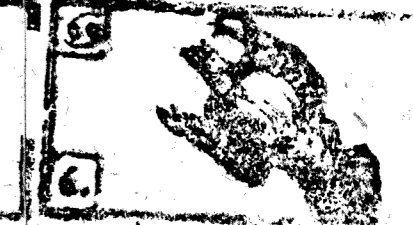
Junio tiene 30. dias la Luna 29.