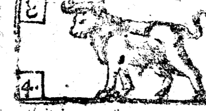
Abril tiene 30. dias la Luna 29.