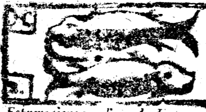
Febrero tiene 29. dias y la Luna 30.