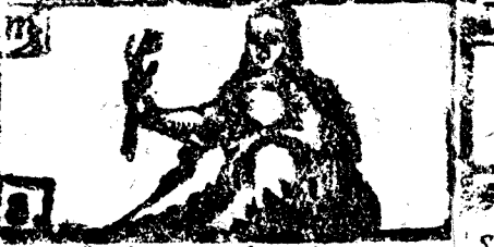
Agosto tiene 31 dias, la Luna 30.

24 Dom. f. Christina virg. y mart. 25 Lun. Santiago Apóstol Patron de España, y f. Chistoval m. * Merita de la m. en Taur. temp. con vien.