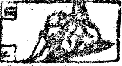
Enero tiene 31. dias la Luna 30.

Inicio del Año. Analogia Typhoco la continua jornada de remitir los Dioses con barba larga a la gran Nave, hasta que Regla mueren el Dios Pan estuviere convida en la tierra. Eso es, que con las continuadas bueltas del primer móvil buelan los años de un en vno, previniendo a los videntes de lo necesario a la vida humana, más que los Planetas cumplen su buelta, desde Occidente a Oriente, causando la queta el movimiento del hio de Hyppion, que es el Sol, quando llega al primer punto del signo Anul Aries, principio de las quatro Astrologicas. En este tiempo da un neblan la enorada Eglafu buena posada, pues