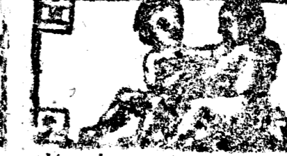
Mayo tiene 31 dias la Luna 30.