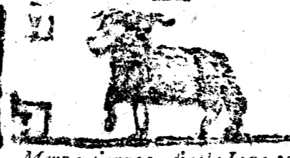
Março tiene 31. dias la Luna 29.