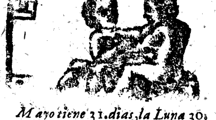
Mayo tiene 31 dias, la Luna 30.

1 Mier. f. Venancio Ob. y mart. 2 Iuev. Santo f. Francisco de Paula, y fanta Mari. Egypciaca. 3 Vier. Santo f. Vlpiano mart. 4 Lun. f. Celestino Papa, y mart. 5 Mart. S. Ciriac, y comp. ms. 6 Mier. f. Dionisio Obispo. 7 Iuev. Santa Casilda Virgen. 8 Sab. f. San Ezequiel Profeta. 9 Dom. f. Leon Papa. 10 Lun. f. Eremegildo, Rey de Esp. 11 Mart. f. Tiburcio, y comp. ms. 12 Mier. f. Basilla, y Anastasio v. y ms. 13 Iuev. f. Santa Engracia v. y m. 14 Vier. f. Aniceto Pap. y m. 15 Dom. f. Iuan de Dios Fundador, y cõf. y f. Iulian Arçob. de Toledo. 16 Lun. f. Santa Francisca viuda Romana. 17 Mar. f. Melitio, y 39. comp. ms. 18 Mier. f. Eulogio Presb. y m. 19 Iuev. f. Gregorio Pap. 20 Sab. f. Rodrigo, y Salomon ms. 21 Dom. f. Luginos mart. * Anima. 22 Lun. f. Iulian m. y f. Patric. Ob. 23 Mar. f. Patricio Ob. y conf. 24 Mier. f. Gabriel Arcang. y f. Narciso Ob. y mart. 25 Iuev. S. Joseph Patriarca. 26 Sab. el Patriarca f. Benito Abad. 27 Dom. f. Deogracias Ob. 28 Lun. f. Victoriano, y comp. ms. 29 Mar. f. Agapito Ob. 30 Mier. La Anuncion de N. Señora, y Encarnacion del Hijo de Dios. 31 Iuev. f. Montano, y Maximad ms. 32 Vier. los Dolores de N. Señora, y f. Ruperto Ob. y m. * Anima. 33 Dom. de Ramos. f. Segundo m. 34 Lun. f. Iuan Climaco Ab. 35 Mart. f. Santa Balbina virg.