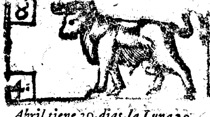
Abril tiene 30 dias, la Luna 29.

1 Do. el Angel de la Guarda. v. f. Leon, y cõp. ms. y f. Rodulind. Ob. y Cõf. * Feria en Guadalajara. 2 Lun. f. Lucio Obisp. 3 Mar. f. Hemeter. y Celed. herm. ms. 4 Mier. f. Casimiro C. y f. Lucio P. y m. 5 Iuev. f. Eusebio, y comp. martires. 6 Vier. f. Victor, y comp. ms. 7 Sab. Santo Tomas de Aquino, y fanta Perpetua, y Felicitas ms. * Anima. 8 Dom. f. Iuan de Dios Fundador, y cõf. y f. Iulian Arçob. de Toledo. 9 Lun. f. Santa Francisca viuda Romana. 10 Mar. f. Melitio, y 39. comp. ms. 11 Mier. f. Eulogio Presb. y m. 12 Iuev. f. Gregorio Pap. 13 Vier. f. Rodrigo, y Salomon ms. 14 Sab. f. Santa Matilde Reyna. 15 Dom. f. Luginos mart. * Anima. 16 Lun. f. Iulian m. y f. Patric. Ob. 17 Mar. f. Patricio Ob. y conf. 18 Mier. f. Gabriel Arcang. y f. Narciso Ob. y mart. 19 Iuev. S. Joseph Patriarca. 20 Sab. el Patriarca f. Benito Abad. 21 Dom. f. Deogracias Ob. 22 Lun. f. Victoriano, y comp. ms. 23 Mar. f. Agapito Ob. 24 Mier. La Anuncion de N. Señora, y Encarnacion del Hijo de Dios. 25 Iuev. f. Montano, y Maximad ms. 26 Vier. los Dolores de N. Señora, y f. Ruperto Ob. y m. * Anima. 27 Mar. f. Castor, y Doroteo ms. 28 Dom. de Ramos. f. Segundo m. 29 Lun. f. Iuan Climaco Ab. 30 Mart. f. Santa Balbina virg.