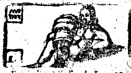
Enero tiene 31 dias, la Luna 30.

Inizio del Año. Por gozar los reflexos de la Aurora, y triunfar de las tinieblas de la noche, buelve la incesante carrera, avirando sus lucientes lagos, y los infatigables Cavallos, hijos del viento, que sin traxidacion que les recharge, intruduben en su dorada Corroza al genero humano, al q̄ el vulgo llama Año Nuevo. Este tiene su principio a 30. de Março a la vnay 52. min. de la mañana, a cen-