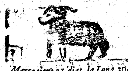
Março tiene 31 dias, la Luna 30.

1 Dom. Septuagesima. f. Ignacio Ob. y m. y fanta Brigida virgen. * An. 2 Lun. La Purificacion de N. Señora. 3 Mart. f. Blas Ob. y mart. 4 Mier. f. Andrés Corfino Ob. 5 Iuev. f. Santa Agueda virg. y mart. 6 Vier. f. Santa Dorotea v. y m. 7 Sab. f. Romualdo Abad. 8 Dom. f. Iuan de Mata Fund. v. f. Pablo Ob. y comp. martires. * Merida. 9 Lun. f. Santa Polonia v. y mart. 10 Mart. f. Santa Escolastica virg. 11 Mier. f. Saturnino Presb. y comp. mart. 12 Iuev. f. Ollala v. y m. y la Primera Translacion de f. Eugenio. 13 Vier. f. Benigno mart. 14 Sab. f. Valentin Presb. y mart. 15 Dom. f. Iuan Paulino, y Iovita ms. 16 Lun. f. Iulian, y comp. ms. 17 Mart. f. Iulian de Capadocia m. 18 Mier. f. Eladio Arçob. de Toledo, y f. Simeon Ob. y mart. 19 Iuev. f. Leon Ob. 20 Sab. f. Felix Ob. 21 Dom. La Cated. de f. Pedro en Antioquia, y f. Palcasio Ob. * Zamora. 22 Lun. f. Marta V. y M. Vigilia. 23 Mar. S. Matias Apóstol. 24 Mier. f. Celarino conf. Tempora. 25 Iuev. f. Alejandro Ob. 26 Vier. f. Leandro Ob. Tempora. 27 Sab. f. Roman Abad. Tempora.