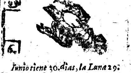
Junio tiene 30 dias, la Luna 29.

1 Vier. S. Phelipe, y Saniago Apóst. * Medellin, y Coria. 2 Sab. f. Atanasio Ob. y conf. 3 Dom. La Invençion de la Santa Cruz. 4 Lun. f. Santa Monica viuda. 5 Mart. La Corona de Espinas, y f. Sacerdote Obispo de Siguença. 6 Mier. f. Iuan Ante-Portam Latinam. 7 Vier. la Apar. de f. Miguel Arcángel. 8 Sab. f. Gregorio Nazianceno. 9 Dom. f. Leon Papa. 10 Lun. f. Eremegildo, Rey de Esp. 11 Mart. f. Tiburcio, y comp. ms. 12 Mier. f. Basilla, y Anastasio v. y ms. 13 Iuev. f. Santa Engracia v. y m. 14 Vier. f. Aniceto Pap. y m. 15 Dom. f. Iuan de Dios Fundador, y cõf. y f. Iulian Arçob. de Toledo. 16 Lun. f. Santa Francisca viuda Romana. 17 Mar. f. Melitio, y 39. comp. ms. 18 Mier. f. Eulogio Presb. y m. 19 Iuev. f. Gregorio Pap. 20 Sab. f. Rodrigo, y Salomon ms. 21 Dom. f. Luginos mart. * Anima. 22 Lun. f. Iulian m. y f. Patric. Ob. 23 Mar. f. Patricio Ob. y conf. 24 Mier. f. Gabriel Arcang. y f. Narciso Ob. y mart. 25 Iuev. S. Joseph Patriarca. 26 Sab. el Patriarca f. Benito Abad. 27 Dom. f. Deogracias Ob. 28 Lun. f. Victoriano, y comp. ms. 29 Mar. f. Agapito Ob. 30 Mier. La Anuncion de N. Señora, y Encarnacion del Hijo de Dios. 31 Iuev. f. Montano, y Maximad ms. 32 Vier. los Dolores de N. Señora, y f. Ruperto Ob. y m. * Anima. 33 Dom. de Ramos. f. Segundo m. 34 Lun. f. Iuan Climaco Ab. 35 Mart. f. Santa Balbina virg.