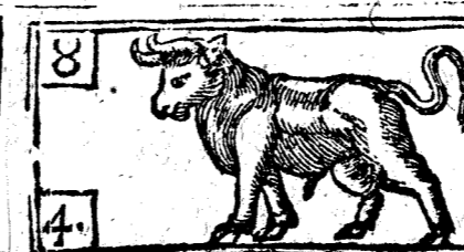
Abril tiene 30. dias, la Luna 29.