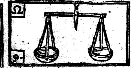
Septiembre tiene 30. dias, la Luna 29.

1 Dom. f. Pedro Advincula, y los siete Santos Macabeos hermanos mart.