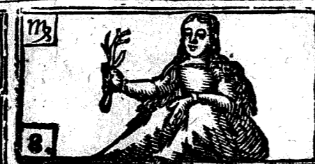
Agosto tiene 31. dias, la Luna 30.

1 Iuev. f. Calto, y Secudino Ob. y m. 2 Vier. la Visitacion de N. Señora, y f. Proceso, y Martiniano mart.