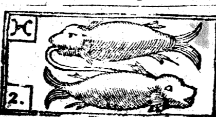
Febrero tiene 28. dias, la Luna 29