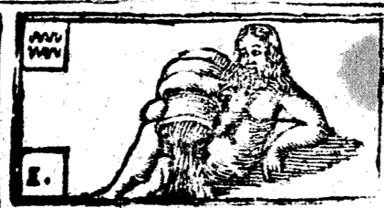
Enero tiene 31. dias, la Luna 30.

Inizio del Año. La estacion del Invierno tiene principio el día 21. de Diziembre de 1705. à las 9. y 2. ms. de la noche, ascendiendo el signo de Leon, y mediando el cielo el signo de Tauro: seràn sus dominantes el Planeta Venus, y el guerrero Marte, no negando à Saturno el ser participante en el dominio; y por ser de varios influxos, avrà variedad, y grandes mutaciones en los temporales, haziendo vientos frios, copiosa lluvia, y algunas nieves: las enfermedades seràn de la naturaleza de Marte. La Primavera tiene principio el día 20. de Março à las 8. y 29. ms. de la noche, ascendiendo el signo de Escorpion, y en el medio cielo el signo de Leon; es governada de Venus, y Marte; haràn el tiempo bastantemente hu-