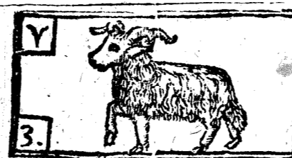
Março tiene 31. dias, la Luna 30.