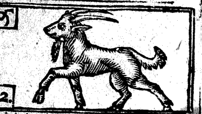
Diciembre tiene 31. la Luna 30.

1 Lun. la Fiesta de Todos los Santos. * Leon, y Piña.