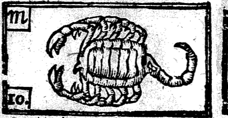
Octubre tiene 31. dias, la Luna 30.

1 Mierc. f. Vicente, y Leto ms. y f. Gil Abad, y los 12. herm. ms. * Sorja.