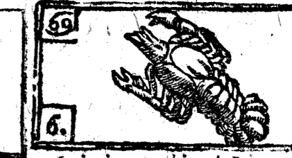
Junio tiene 30. dias, la Luna 29.