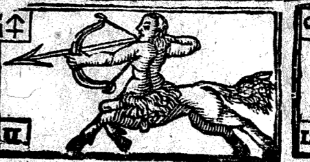
Noviembre tiene 30. dias, la Luna 29.

1 Viern. f. Remigio Ob. y conf. 2 Sab. f. Leodegario Ob. y mart.