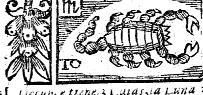
Junio 30 dias, la Luna 29.