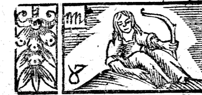
April 30 dias, la Luna 30.