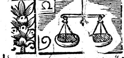
Mayo 31 dias, la Luna 29.