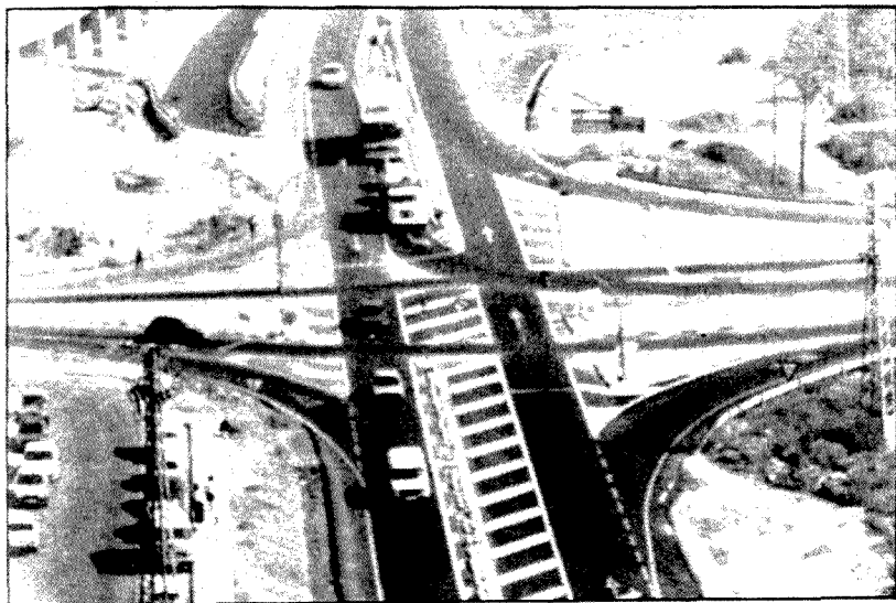
El «nudo» de Safont cambiará muy pronto de fisonomía.

Actualmente son más de ochocientos los municipios de nuestra región que disponen de algún centro de atención social, existiendo, además, cuarenta equipos de atención primaria, de los que la mitad están repartidos en núcleos rurales. Respecto al mantenimiento y personal de estos centros, De la Cámara ha sido claro al destacar que estas instalaciones deben ser conservadas y gestionadas por los ayuntamientos, por lo que deberían mentalizarse en incluir en sus consignaciones presupuestarias cantidades distintas a estos fines. En cualquier caso, se ha señalado, la Consejería firmará próximamente un convenio de colaboración con varios ayuntamientos para financiar en parte actividades de los centros sociales.