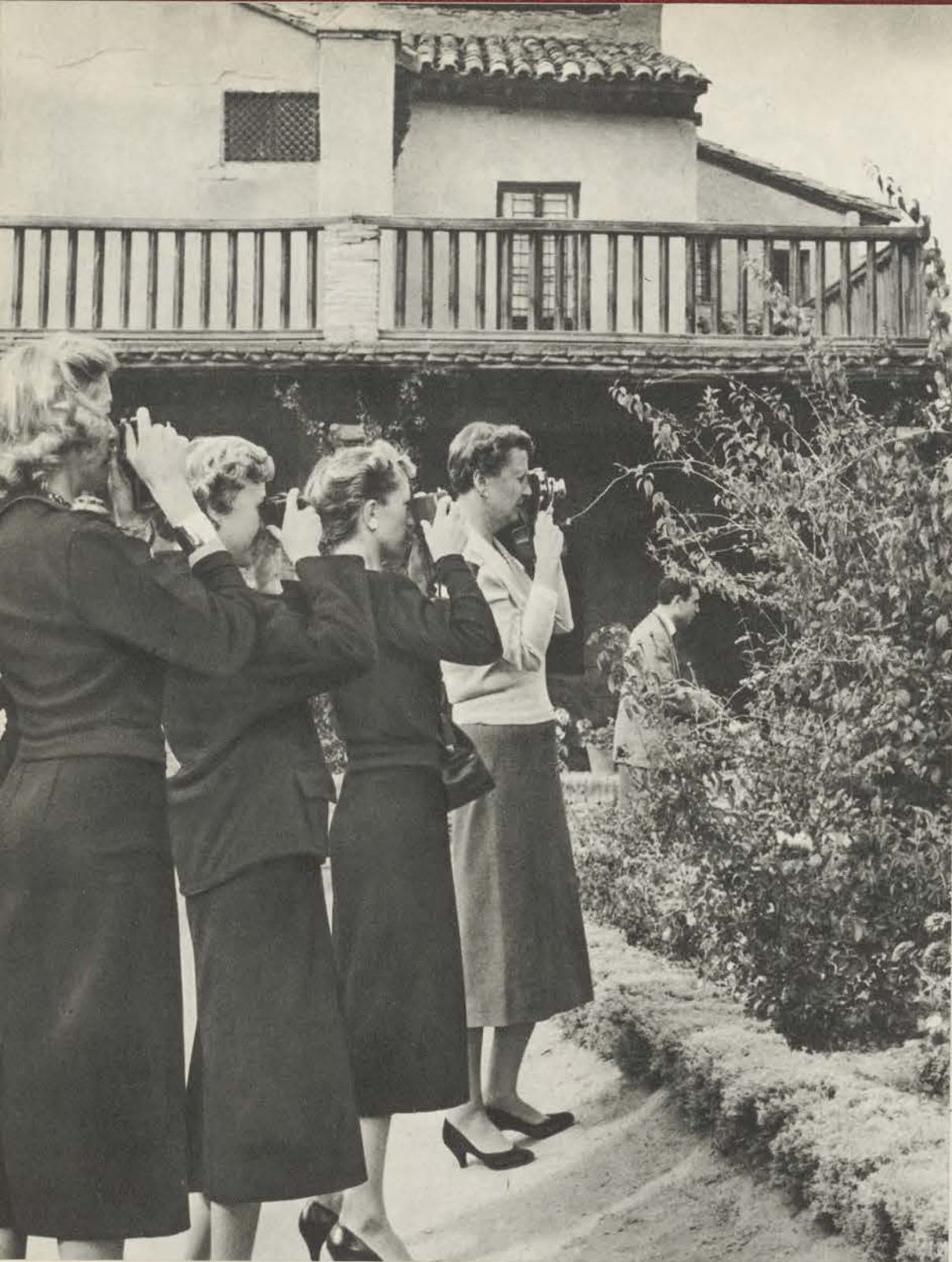
En el patio de la casa del Greco, en Toledo, las Mary Gordon pusieron también sus respectivas cámaras fotográficas al servicio de la mejor información, para no confiar a la memoria tantos importantes detalles.

Las infatigables viajeras de todos los meridianos y todas las grandes avenidas del mundo enfilan una típica calle toledana hacia el Museo del Greco.