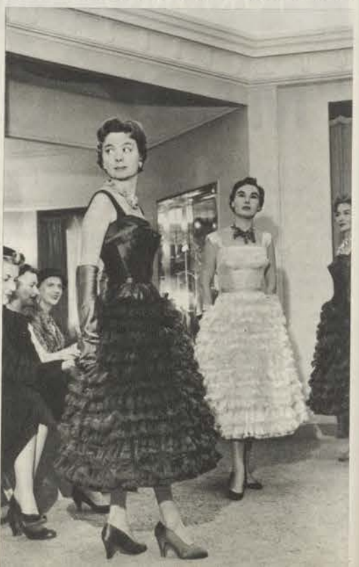
contemplación de modelos, mientras apuntaban precios y características de la moda en España.

Continúa el desfile en Pedro Rodríguez ante las ilustres visitantes. Los tres modelos son de organza de distintos colores, con volantes de flecos.