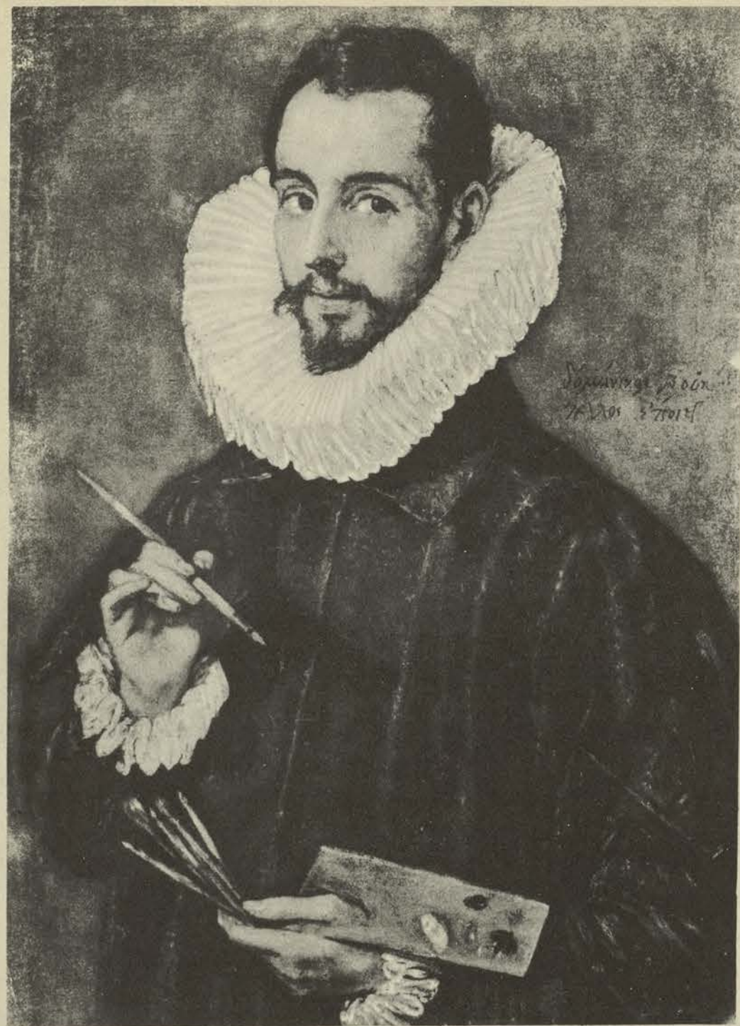
RETRATO DE JORGE MANUEL THEOTOCOPULI, HIJO DE «EL GRECO», regalado al Museo de Sevilla, por los Duques de Montpensier.

EL SOPLON ENTRE UN HOMBRE Y UN MONO, que se halla en la Colección de Wiesbaden.