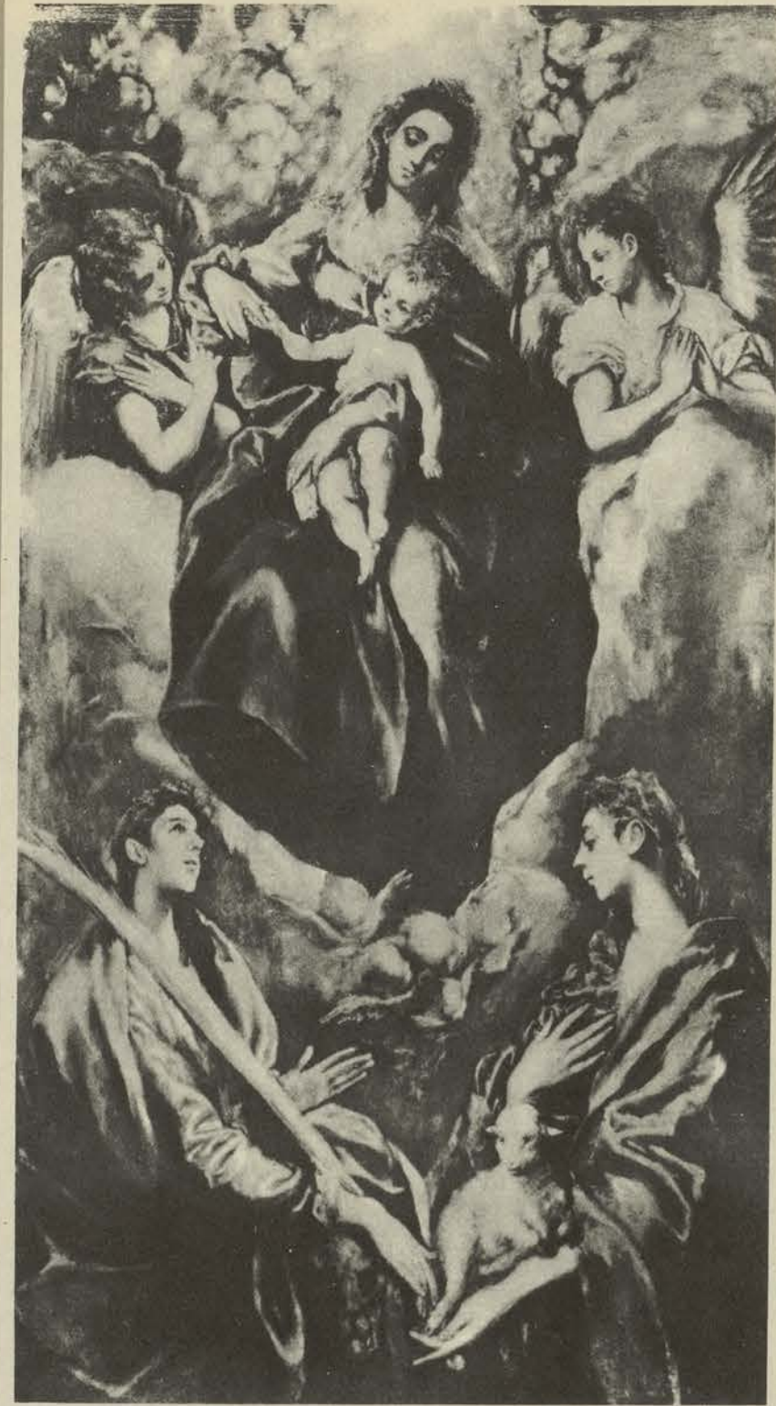
LA VIRGEN CON EL NIÑO EN BRAZOS, ENTRE ANGELES. — Abajo, LAS SANTAS MARTA e INES. Este cuadro, pertenece actualmente a la Colección Widener, de Filadelfia.