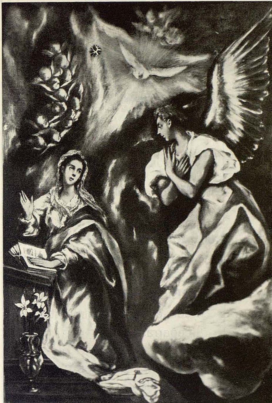
Anunciación. CATEDRAL DE SIGÜENZA

La sensualidad que hubiese podido captar a su paso por Roma y por Venecia la disolvió el rumor del Tajo discurriendo noche y día en su lecho de peñascos. Quizá este tronar del agua que él escuchaba desde su aposento en las casas de Villena, el vuelo de las aguilillas y los alcotanes en el anochecer toledano o las madrugadas