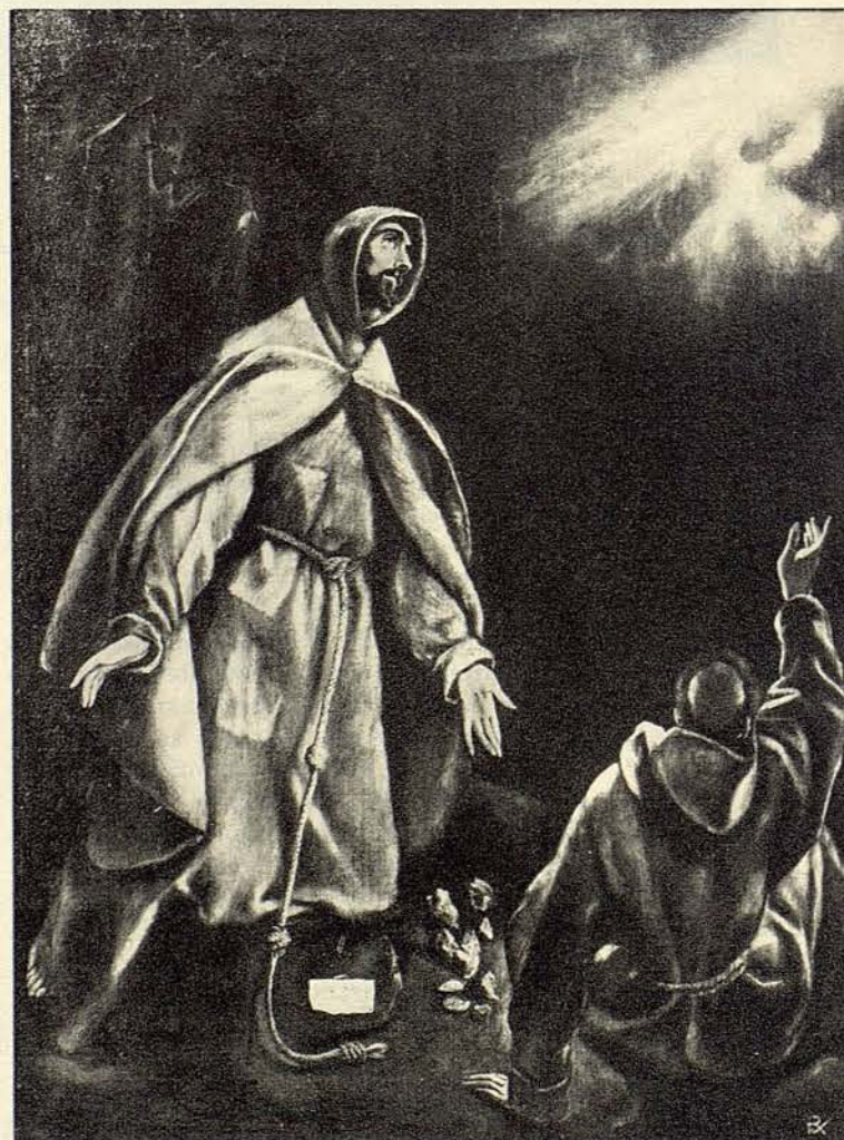
San Francisco. MUSEO CERRALBO. MADRID