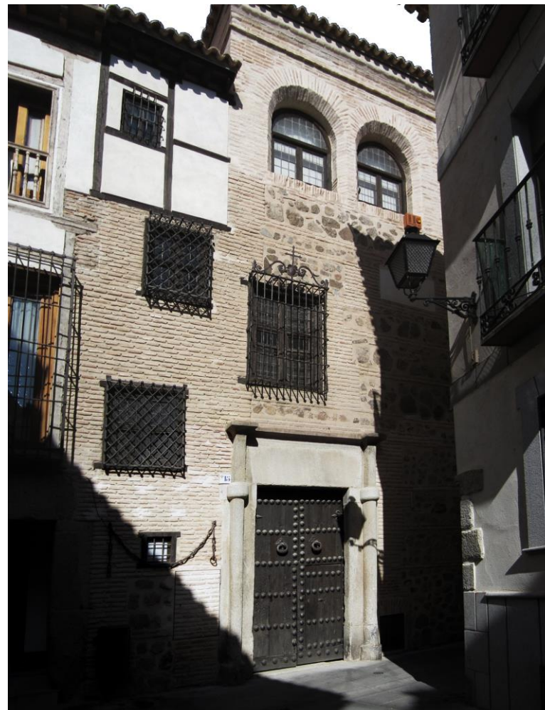
VISTA DE LA FACHADA