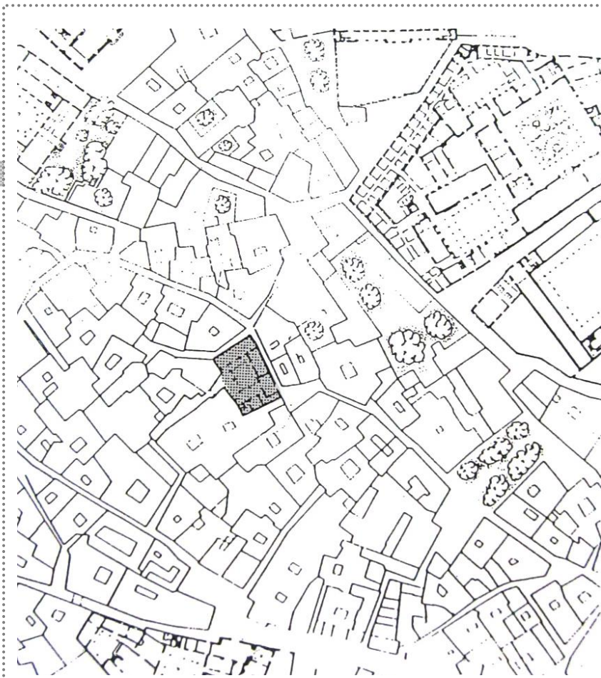
Plano de la PLANTA BAJA