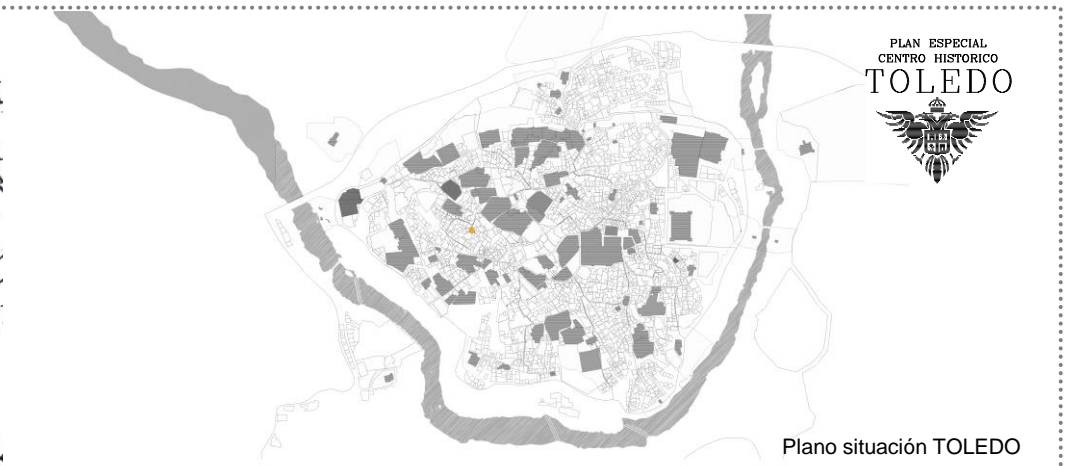
Plano situación TOLEDO