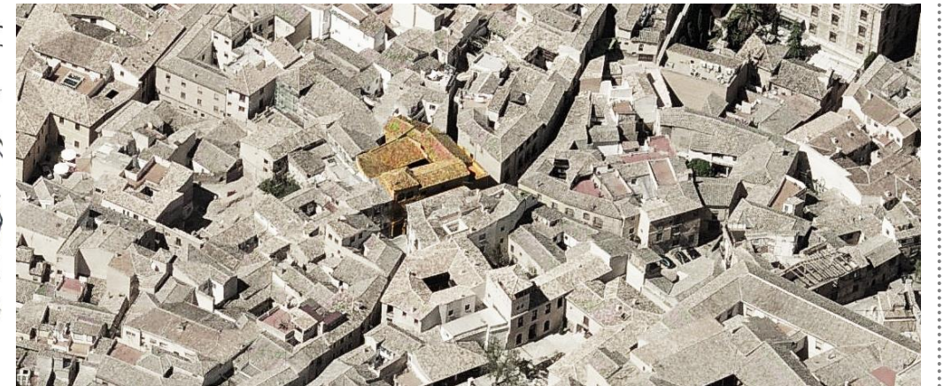
Vista aérea del conjunto