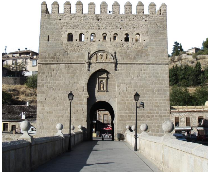
VISTA DE LA ENTRADA AL PUENTE