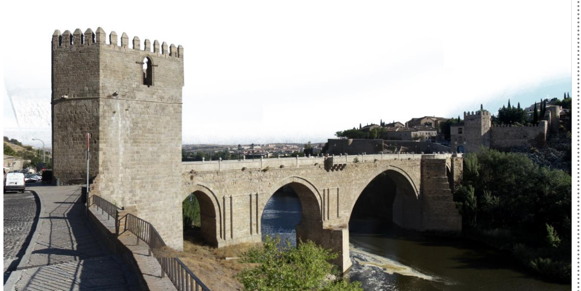
VISTA DESDE LA CARRETERA DE PIEDRABUENA