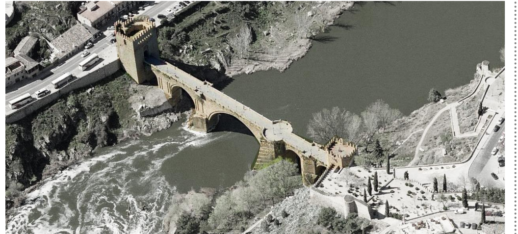
Vista aérea del conjunto