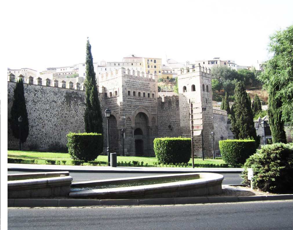
VISTA DESDE LA CALLE ALFONSO VI

MONUMENTO DECLARADO R.ORDEN 21/12/1921 GACETA 25/12/1921 ENTORNO PROTEGIBLE DECRETO 119/1998 DOCM 18/12/1998