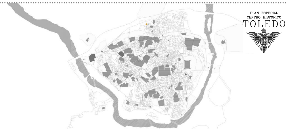
Plano situación TOLEDO