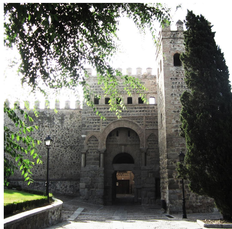
VISTA DE LA PUERTA

3.3. CONSTRUCCION La parte inferior de sus torres esta realizada en sillería reutilizada, que también conforma el arco de ingreso, en cuya clave se conserva una piedra caliza decorada con un motivo vegetal visigodo. Ha contado con una consolidación en el año 2000.