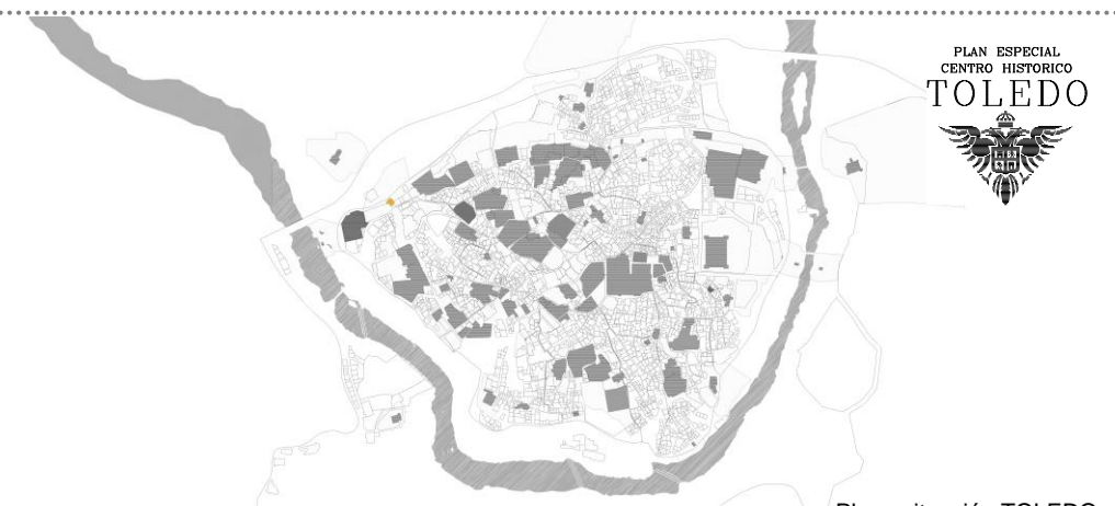
Plano situación TOLEDO