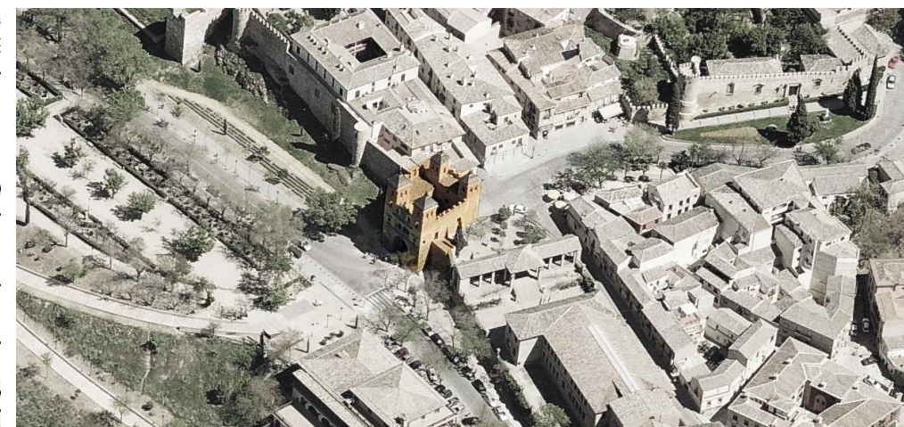
Vista aérea del con junto