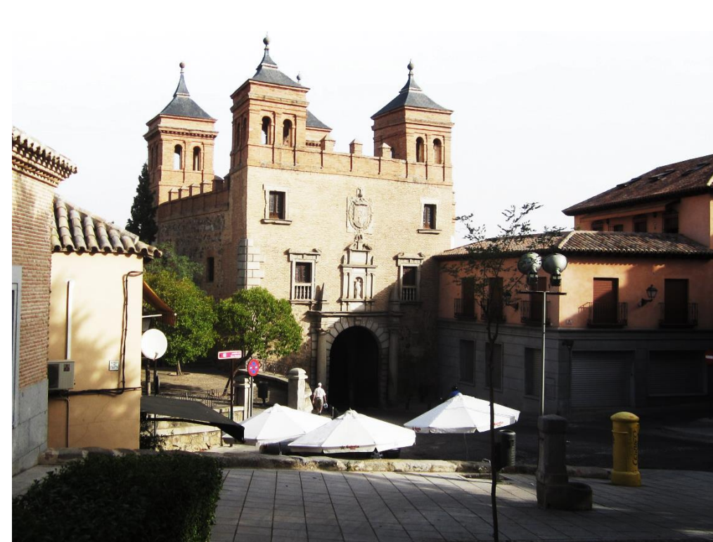
VISTA DE LA PUERTA DESDE LA CUESTA DE SAN MARTÍN