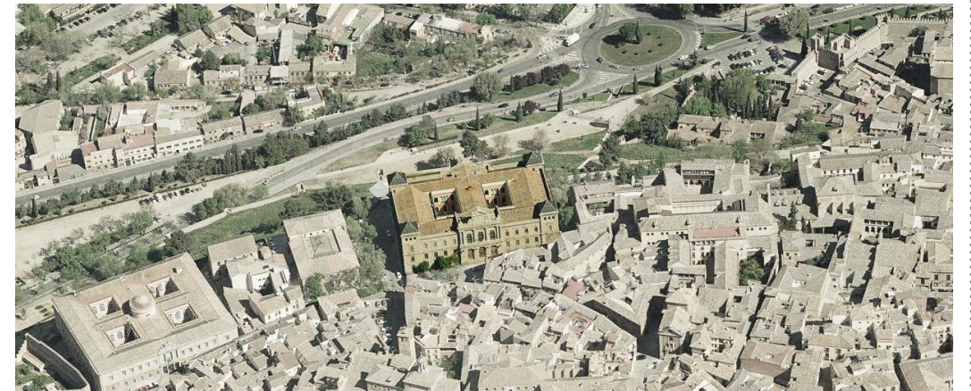
Vista aérea del conjunto