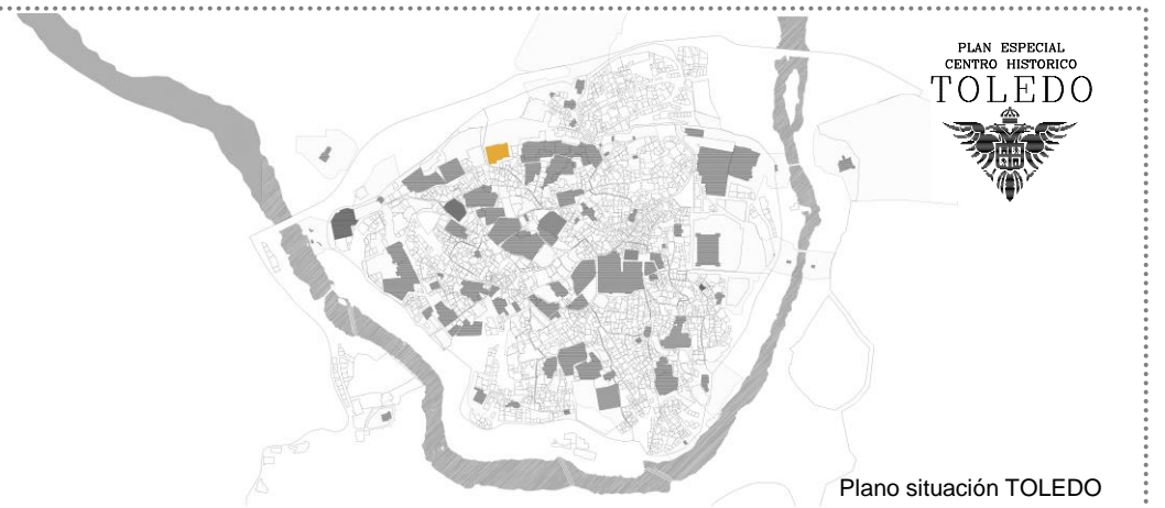
Plano situación TOLEDO