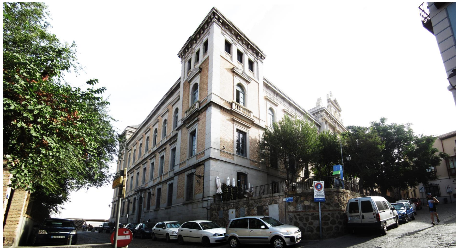
VISTA EXTERIOR DE LA DIPUTACIÓN

De los aspectos más importantes del sistema constructivo destaca el llevar a la planta principal los arcos de medio punto, que originalmente no estaban pensados así. Composición en piedra y enlucido color ocre.