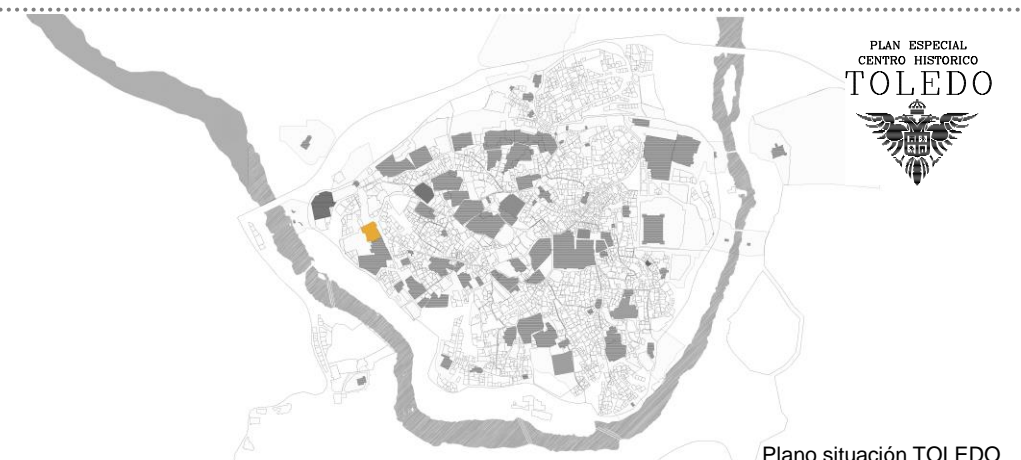
Plano situación TOLEDO