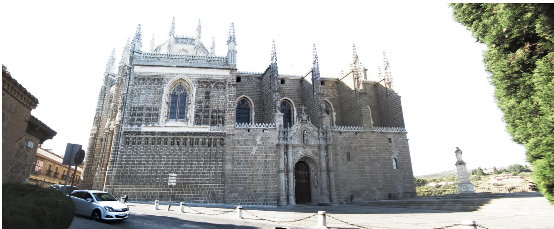
VISTA FACHADA PRINCIPAL

3.3. CONSTRUCCION Construcción toda en piedra, destaca el artesonado con motivos geométricos en greca árabe del segundo piso del claustro.