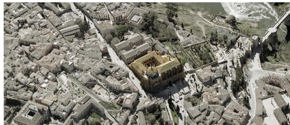
Vista aérea del conjunto