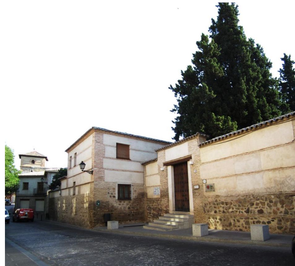
VISTA DESDE CALLE DE LOS REYES CATÓLICOS

3.1. TIPOLOGIA Edificio medianero con viviendas en una de sus fachadas laterales. 3.2. DESCRIPCION Trazado irregular de la planta dividida en cinco naves terminadas las tres centrales en tres capillas con cubiertas avenaradas. 3.3. CONSTRUCCION Acabado exterior de ladrillo rebozado. Cubierta de teja. Puerta de entrada de piedra.