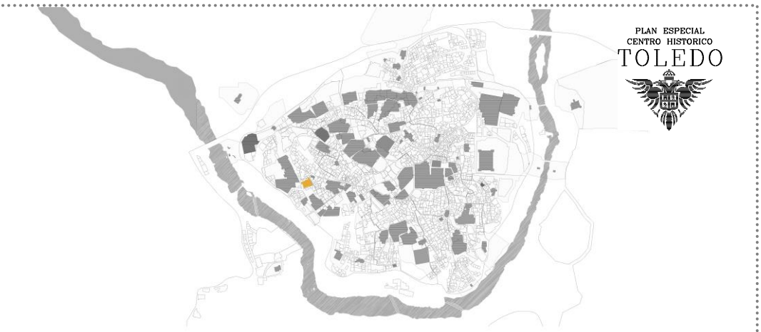
Plano situación TOLEDO