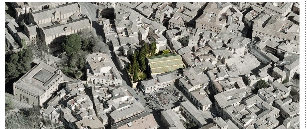
Vista aérea del conjuento