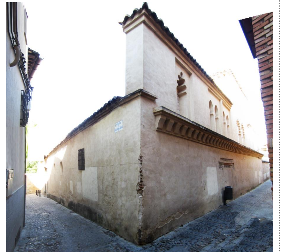
VISTA DESDE CALLE DE LA JUDERÍA

MONUMENTO DECLARADO R.ORDEN 4/07/1930 BOP 08/07/1930 ENTORNO PROTEGIBLE DOCM 29/11/1996