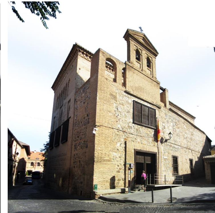
VISTAS DESDE EL PASEO DEL TRÁNSITO

MONUMENTO DECLARADO R.ORDEN 01/05/1877 ENTORNO PROTEGIBLE DECRETO 115/2001 DOCM 20/04/2001