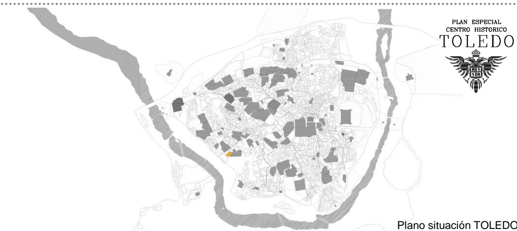
Plano situación TOLEDO