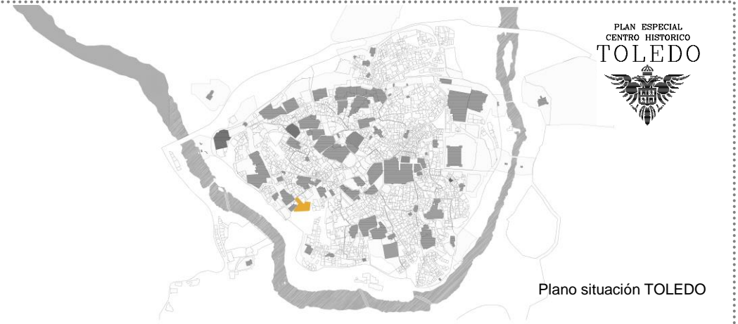
Plano situación TOLEDO