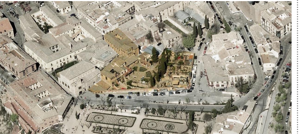
Vista aérea del conjunto