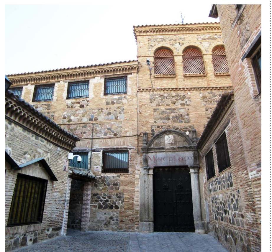
VISTA EXTERIOR DE LA CASA

MONUMENTO DECLARADO DECRETO 9/08/1926 BOE 4/06/1931 ENTORNO PROTEGIBLE DOCM 22/11/2002