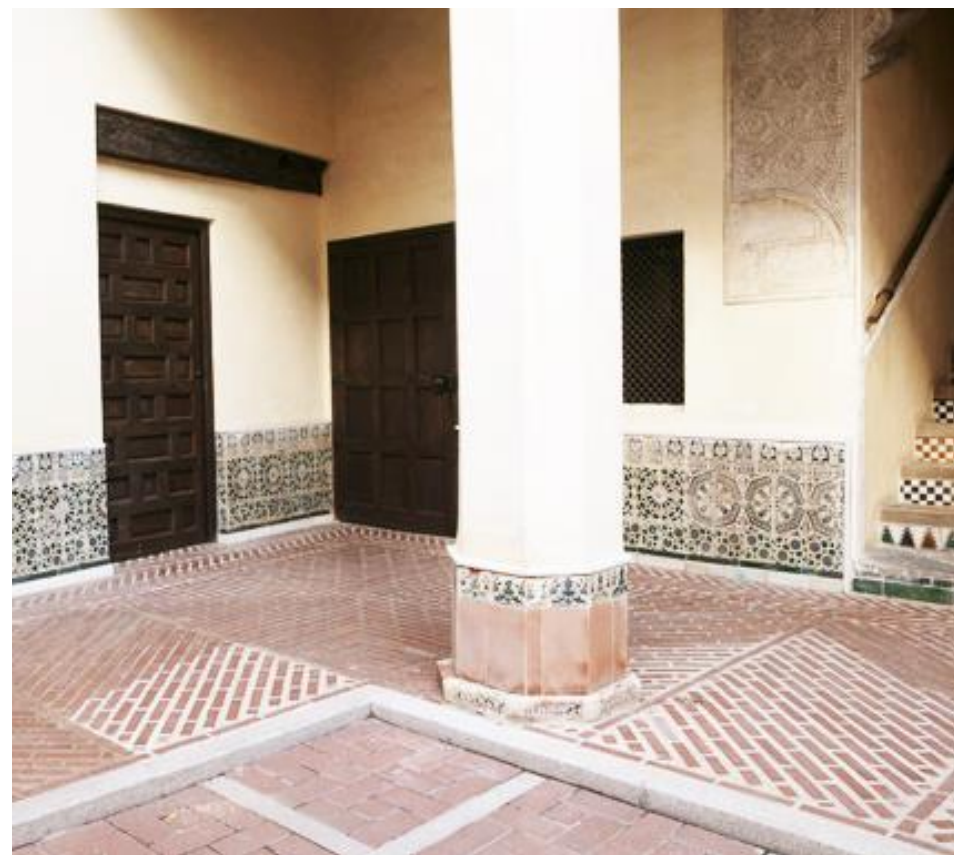
VISTA DEL PATIO INTERIOR

3.3. CONSTRUCCIÓN Ladrillos y cajeados de mampostería. Cubierta de teja.