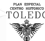
Plano situación TOLEDO