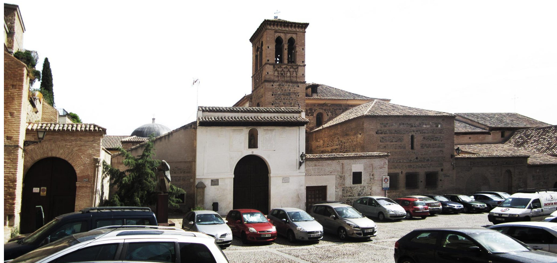
VISTA EXTERIOR DEL CONVENTO

De la antigua construcción se conserva la torre mudéjar de ladrillo y mampostería. La iglesia es de mampostería con verdugadas de ladrillo.