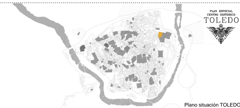
Plano situación TOLEDO