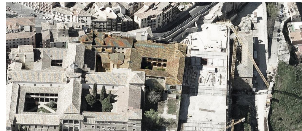
Vista aérea del conjunto