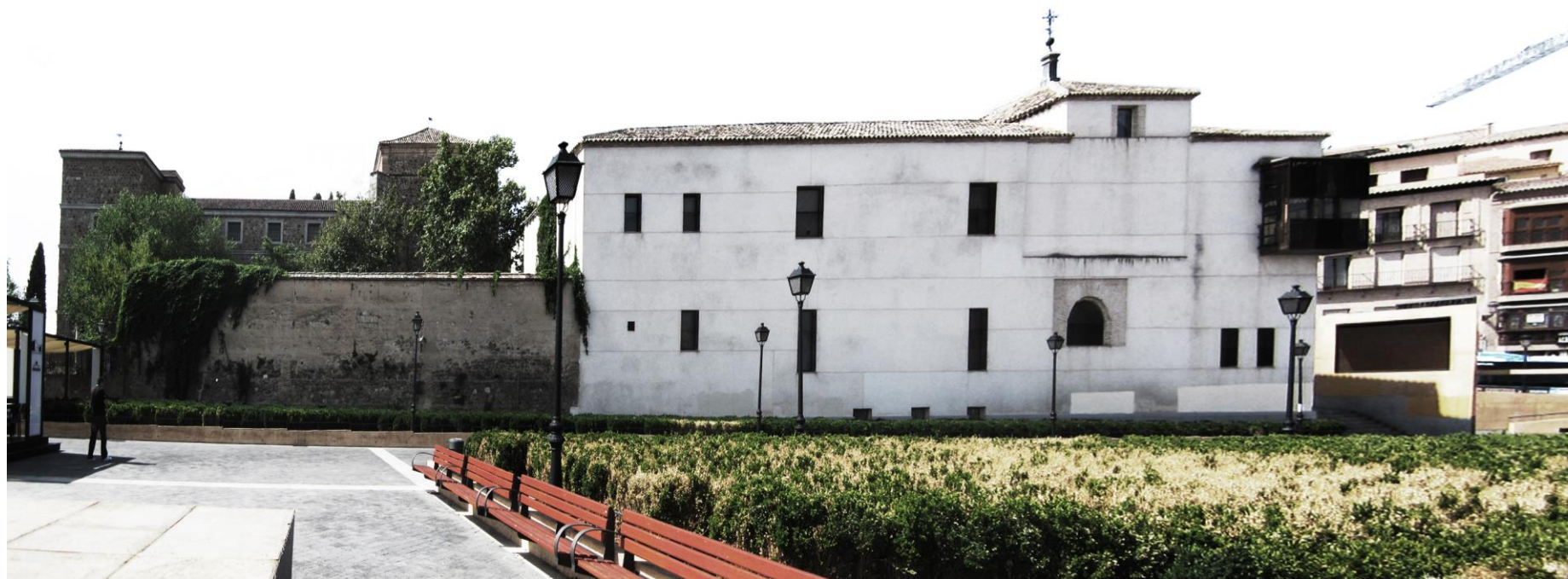
VISTA EXTERIOR DEL CONVENTO

Se destaca en la iglesia el tramo del ábside cubierto por una bóveda de ladrillo por aproximación de hiladas. El tramo rectangular se cubre con bóveda de cañón.